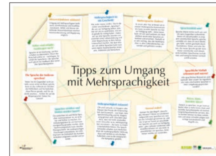
Faltplakat „Viele Sprachen? Kein Problem!“