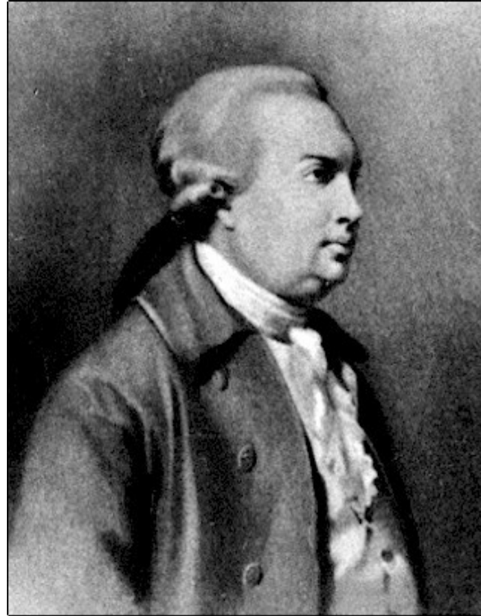
Неизвестный художник 18 века

ФОНВИЗИН Денис Иванович (1744 или 1745-1792) , русский писатель, просветитель. В комедии "Бригадир" (постановка 1770) сатирически изобразил нравы дворянского сословия, его пристрастие ко всему французскому. В комедии "Недоросль" (постановка 1782), этапном произведении русской литературы, Фонвизин, видя корень всех бед России в крепостном праве, высмеивал систему дворянского воспитания и образования.