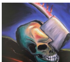
Jiří Georg Dokoupil