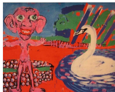
Jaroslav Róna, 1984 Jaro na vsi