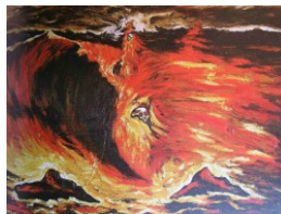
Enzo Cucchi, 1983 300x400cm