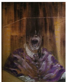
Francis Bacon, 1949 Hlava VI, 93x77cm