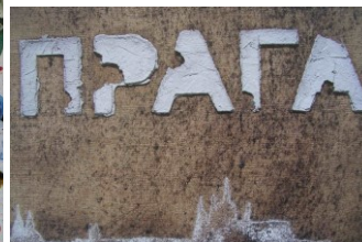
J. G. Dokoupil Výstava v Domě umění, 2005