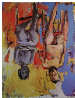
Georg Baselitz, 1975 Rodinný portrét