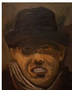
A. R. Penck Aoutoportrét s kloboukem,