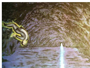
Sandro Chia Modrá jeskyně, 1980