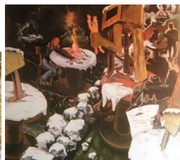
Jörg Immendorf, 1978 Schnee-Café Deutschland