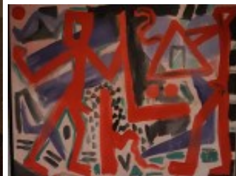
A. R. Penck, 1979 Konec na Východě 1958