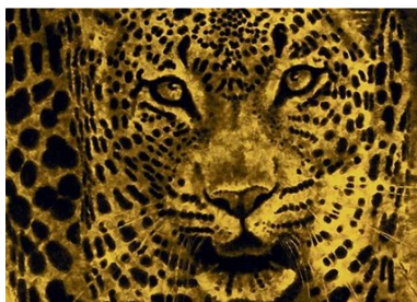
J. G. Dokoupil: Velký žlutý leopard Výřez z malby 600x338cm