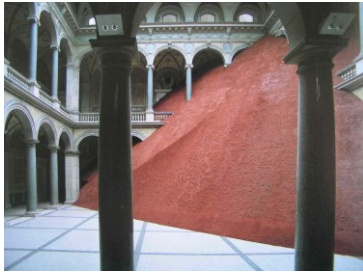
Magdalena Jetelová Domestikace pyramidy, 1992 Muzeum užitého umění, Vídeň