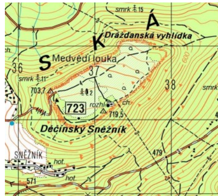
Obr. 2: Výřez z topografické mapy