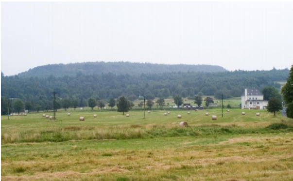
Obr. 1: Děčínský Sněžník pohled SV směrem, autor: Petr Novák

Jedná se o strukturní typ reliéfu. Stolovou horu budují druhohorní kvádrové pískovce. Hora je protažená ve směru JZ-SV. Vyskytují se zde útvary zvětrávání pískovců: skalní věže, balvanové proudy pseudokrasové jeskyně a další (např. pukliny, škrapy). Nejvyšší bodem je Děčínský Sněžník 723,1 m n. m.