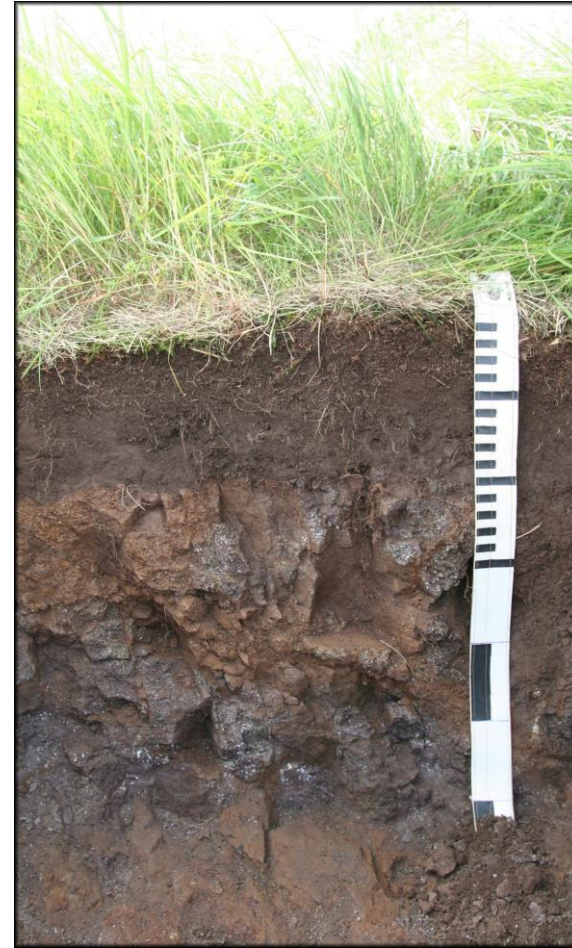
Hnědozem, Glej, Ranker