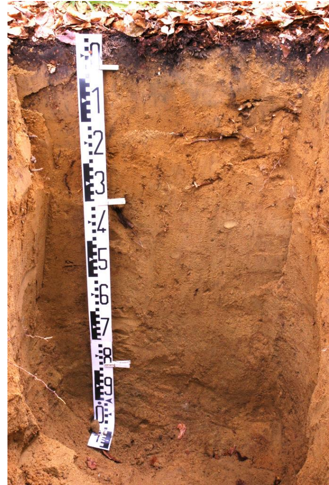
Rendzina, Pseudoglej, Kambizem