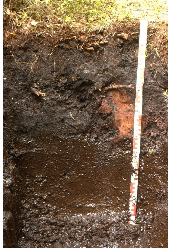
Podzol, Slanec, Organozem