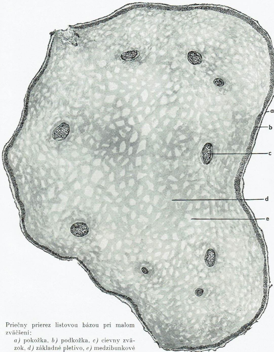
Priečny prierez listovou bázou pri malom zväčšení: a) pokožka, b) podkožka, c) cievny zväzok, d) základné pletivo, e) medzibunkové priestory