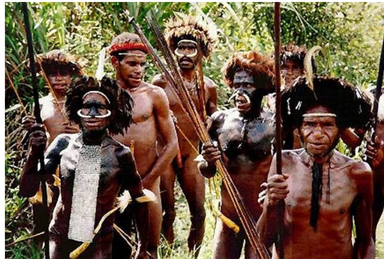
Obr. 1: kmen Fore

Příslušníci kmene Fore až donedávna vyjadřovali svým zemřelým úctu tím, že snědli jejich maso a mozek. Tento druh pohřebních rituálů měl ovšem tragické následky v podobě onemocnění kuru, které ve 20. století zahubilo asi 2500 zdejších kanibalů.