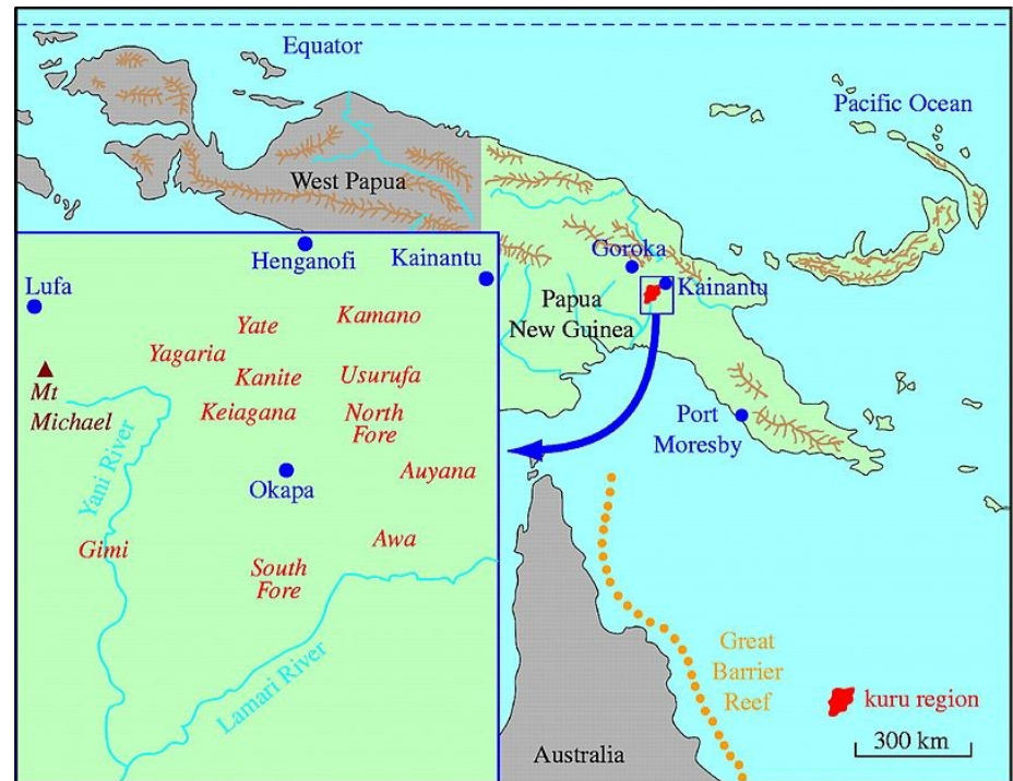
Obr. 2: oblast obývaná kmen Fore