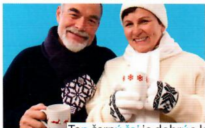
Ten černý čaj je dobrý a kvalitní.