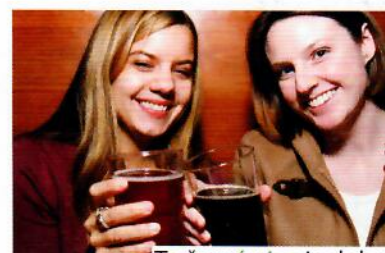
To černé pivo je dobré a kvalitní.