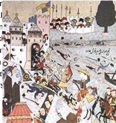
Belagerung Belgrads durch die Osmanen, 1521

Seit 1437 herrschten Könige aus dem Haus Habsburg über das Reich. Das gleiche Herrscherhaus saß infolge seiner Macht im Beginn des 16. Jahrhunderts auch in Spanien. Als spanischen Habsburger Karl, den Kaiser Maximilian II. wählten, bahnte sich im politischen Bereich die Reformation an; denn mit dieser Wahl wurde das Reich in die großen innerpolitischen Auseinandersetzungen zwischen Katholikern und Protestanten verwickelt. Zur gleichen Zeit erlebte es an der Ostgrenze durch die Türken, die 1529 erstmals bis nach Wien vordrangen.