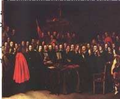
Der Friedensschwur zu Münster am Ende des Dreißigjährigen Krieges 1648

seinen Grenzen ein. Entscheidender noch als diese Gebietsverluste waren aber jene verfassungsrechtlichen Bestimmungen, die den deutschen Fürsten, selbst den allerkleinsten, die volle Landeshoheit gewährten, ihnen ausdrücklich das Recht gaben, Bündnisse untereinander und mit dem Ausland zu schließen. Die alte Einheit des Reiches war damit endgültig zerbrochen. Es blieb nur noch ein lockerer Zusammenschluß, den ein Zeitgenosse zu Recht ein "staubiges Bündnis" nannte. Für mehr als zwei Jahrhunderte löste sich Deutschland in die Geschichte der einzelnen Länder. Noch blieben die Reichsbehörden zentralisiert in der Person des Kaisers, der fast nur in Wien residierte, und in den Reichsregimenten, die ein Reichsheer und Reichsbehörden, aber kaum mehr ein Reichsbewußtsein.