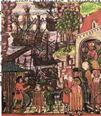
Geschäftiges Treiben im Hamburger Hafen (Mittelalterliche Malerei)

Das ausgehende 15. und beginnende 16. Jahrhundert in Deutschland hat ein Historiker einmal als die "Zeit der großen Wende" bezeichnet. Tatsächlich erfaßte ein rascher Wandel alle Bereiche des kulturellen und sozialen Lebens. Im Innern des Reiches wurde das im Niedergang begriffene Rittertum verlor durch die Knechte als Fußtruppen endgültig seine militärische Bedeutung. In den Städten Handlungsbühnen der Bürger in den Handelsstädten. Handelsgesellschaften wie die Fugger und Welser in Augsburg leiteten eine Epoche der Renaissance ein. Sehr rasch fanden sie Anschluß an den internationalen Handel, der durch die großen Entdeckungen zu Beginn des 16. Jahrhunderts seinen Aufschwung erlebte.