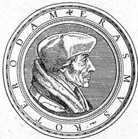
HOLBEINŮV PORTRÉT VELKÉHO RENASANČNÍHO MISTRA ERASMA ROTTERDAMSKÉHO

tušené kontinenty, lidé, bohatství. Zároveň však jde i o kulturní otevření k dávno zapomenutým zdrojům vlastní kultury. Uvedli jsme, že člověk renesance dychtivě objevuje kulturní poklady řecké a římské vzdělanosti. Při tomto objevování získává nejen nové vědomosti, ale také nové metody. Jen popis této cesty za kritickým poznáním antického dědictví by vyžadoval celé kapitoly. Renesanční člověk, který se humanismem vrací ke zdrojům a k pokladům antické kultury, chce poznat nejen její krásu, tj. jít nejen za estetickým a estétským požitkem: otevření a zpřístupnění antické kultury pro něj znamená především podstatné rozšíření kulturního zázemí a vědomostí.*) Ke kánonu středověké vzdělanosti dodává renesanční učenec nové, vlastně staronové vědomosti. Zpřístupňuje celou řadu antických myslitelů, které středověk znal jen nedokonale, nebo vůbec ne. Důležité jsou při tom dvě skutečnosti: jednak sám rozsah vědomostí, jednak kritická metoda, o níž již byla zmínka. Ta sice vede — zdánlivě paradoxně — také k tomu, že svým důrazem na klasický čistý latinský jazyk „očistí“ středověkou latinu, tento univerzální jazyk vzdělanců, od barbarismů, které do ní z různých národních jazyků pronikly, a tím ji nakonec zbaví možnosti dalšího vývoje a učiní z ní vprav-