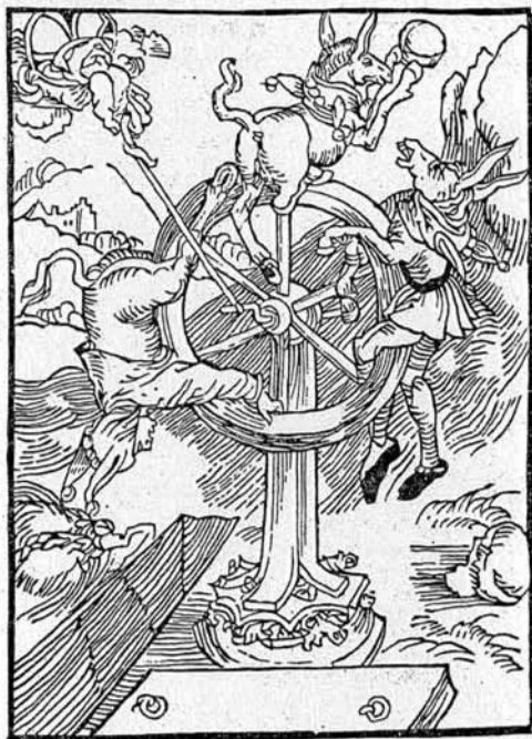
KOLO ŠTĚSTĚNY Z KNIHY SEBASTIANA BRANTA LOĎ BLÁZNŮ (1494) ZNÁZORNŮJE DOBOVĚ OBLÍBĚNÝ MOTIV NESTÁLOSTI LIDSKÉHO OSUDU I MARNOSTI LIDSKÉHO SNAŽENÍ

dě „mrtvý“ klasický jazyk. Na druhé straně však tato kritická snaha, patrná také v rozvoji historických bádání, přispěla velice významnou měrou k prosazení obecné kritičnosti. Přes svou velkou úctu k antickému odkazu i k biblické tradici uvolňuje renesance přece jen tradici takřka bezpodmínečného uznávání vědeckých a náboženských autorit. Na prosazení kritického postoje vůči zděděným pravdám pozitivně působí — vedle humanistického zájmu o odhalení nezkreslených, „pravých“, totiž původních textů a vědomostí — také reformace, jež se rovněž snaží obnovit pravdivé, původní zdroje víry. Je ovšem třeba připustit, že metodicky byla renesanční Evropa pro toto hledání pravdy alespoň do jisté míry připravena rozvojem logického způsobu myšlení, který — jak jsme viděli na příkladu Abélarda a později i scholastické filozofie — zdomácněl na všech významnějších univerzitách.