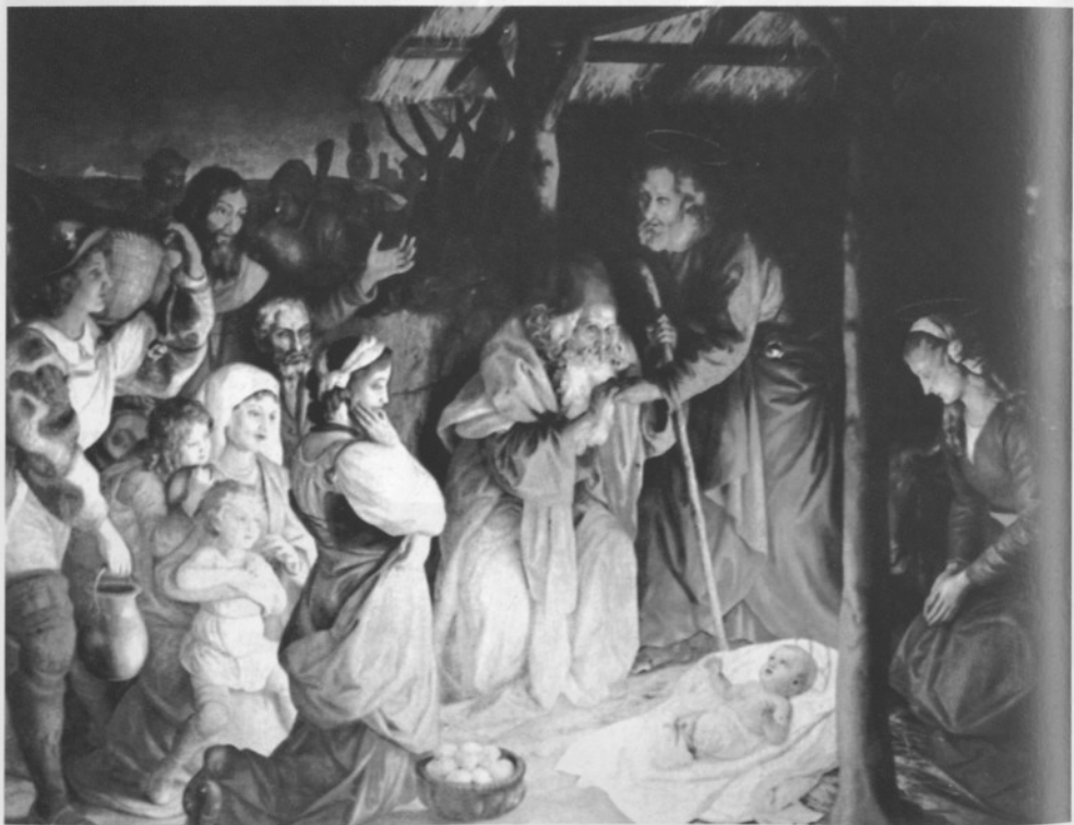
Rođenje Isusovo, poznata slika iz Đakovačke katedrale