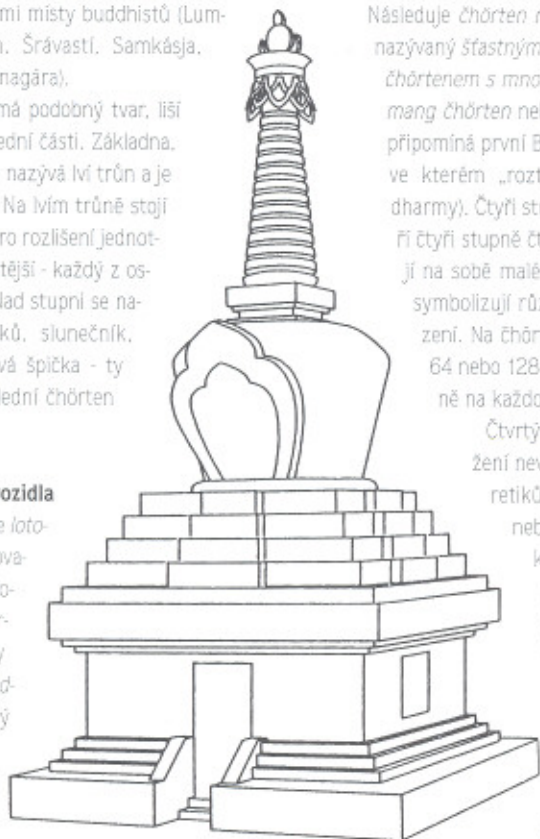
Základní architektura čhörtenu

Dalším je čhörten sestoupení z nebes , také čhörten sestoupení z Tušity nebo čhörten bohů 33 , nebes ( lhabab čhörten nebo lhaläbäb čhörten ), který připomíná Buddhův odchod do Tušity a návrat zpět na zemi. Protože Buddhova matka královna Mája zemřela pouhý týden po narození svého syna, prince Siddharty, ten ji po