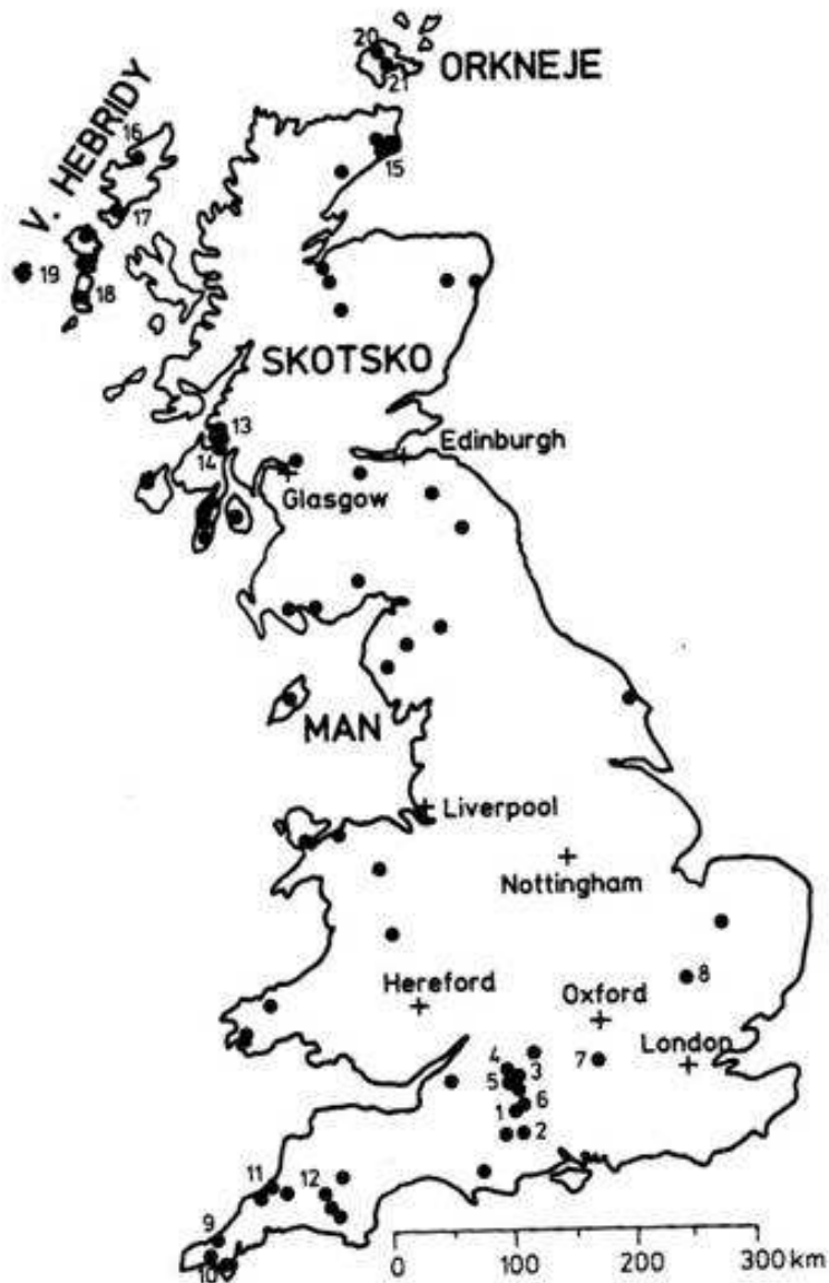
Obr. 16. Megality Británie