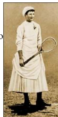
Wimbledon Lawn Tennis Museum

značné pobouření u diváků. Mezi lety 1903 a 1914 se postupně upustilo od nošení klobouků a podpěr šatů. Začaly se objevovat spodničky a korzety.