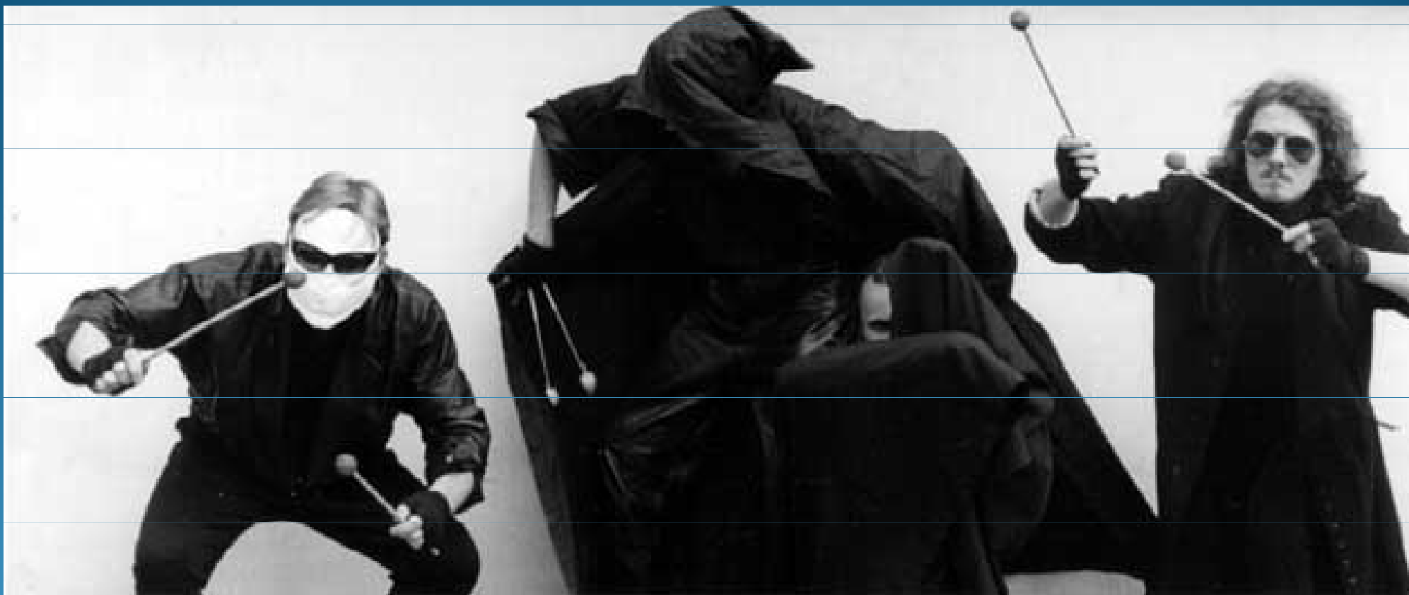
DAMA DAMA – Středoevropský soubor bicích nástrojů