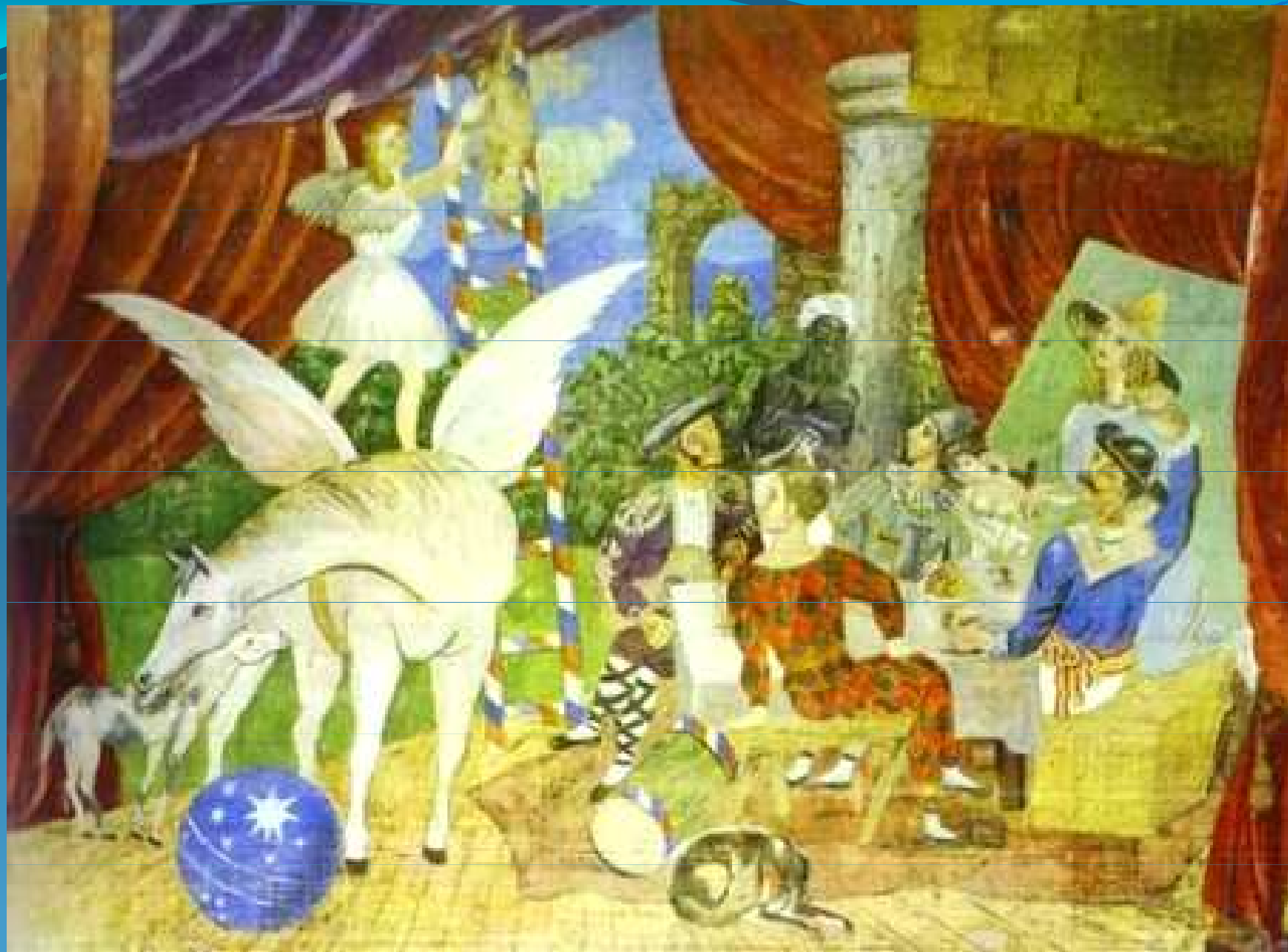
P. Picasso: Opona pro balet Paráda (Satie, Cocteau, Ďagilev), 1916-17