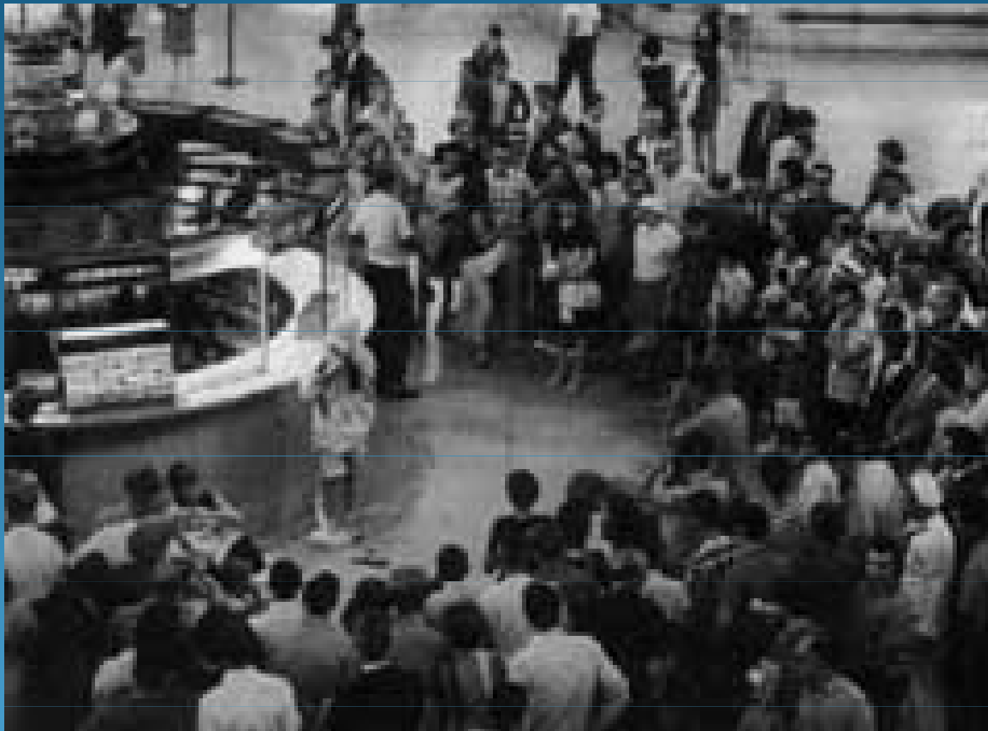
Allan Kaprow: Performance na Grand Central Station, N.Y. City