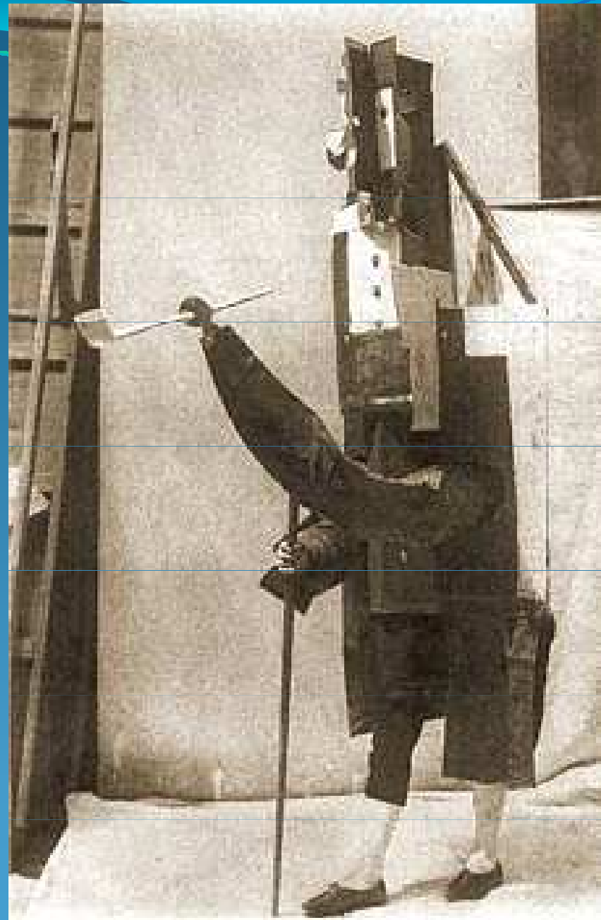
P. Picasso: kostýmy Manažerů pro balet Paráda (1916-17)