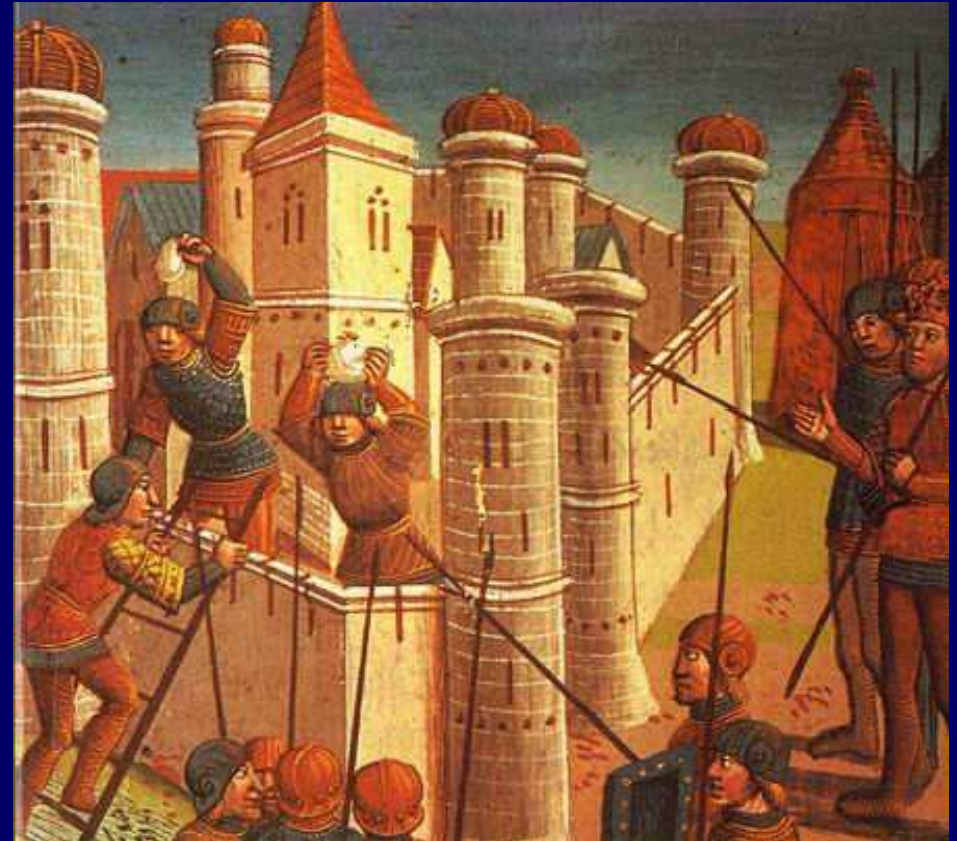
Η πολιορκία της Πόλης, πίνακας από το 1499