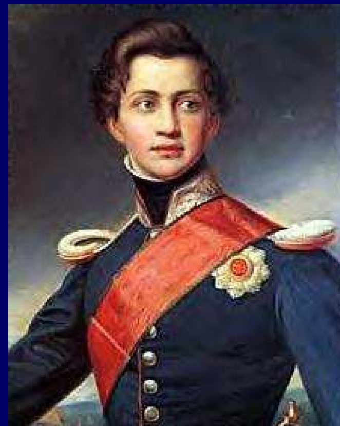
Βασιλιάς Όθωνας Α΄