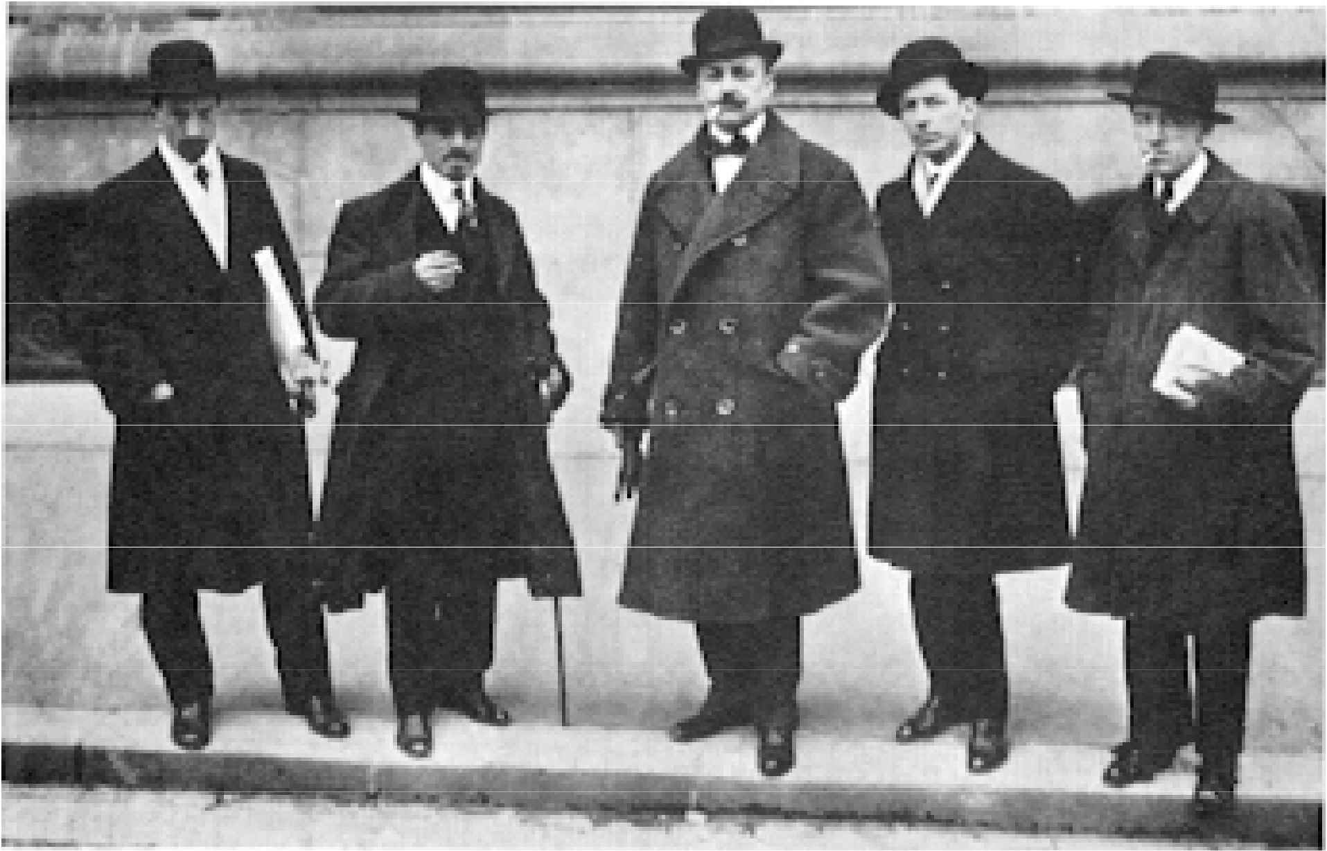
Luigi Russolo, Carlo Carrà, F. T. Marinetti, Umberto Boccioni, Gino Severini (Paříž, 1912)