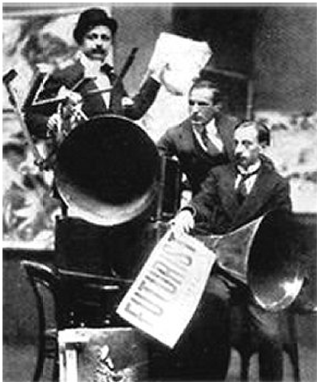
Marinetti, Russolo, Piatti – asi r. 1914