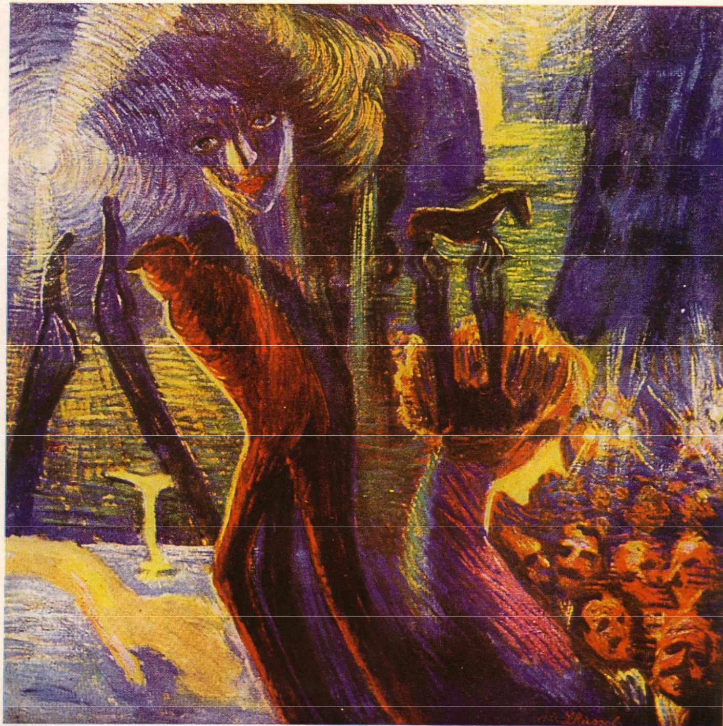
L. Russolo – Vzpomínka na jednu noc (1911)