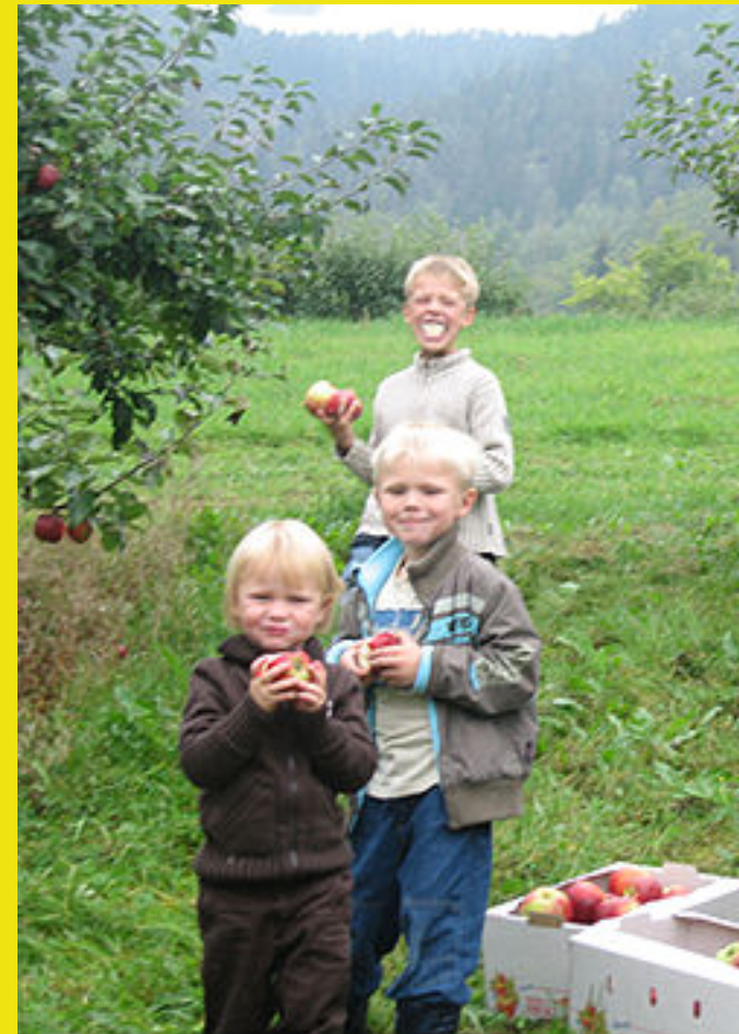
Telemark er et fruktfylke. Hvert fjerde norske eple som selges i Norge, er dyrket i Telemark.