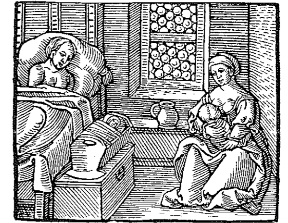
Žena po porodu a kojná. Dřevorez z titulní strany Knihy lékařství mnohých v stavu manželském potřebných, vydané v Olomouci v roce 1609

sukně. Děvče se mělo vykoupat v míse, co se z ní jírávalo, aby se lí- bilo, až vyroste. U chlapců se nedělalo nic, neboť se říkalo: chlapec je vzácný hned, dyž sa narodí; cěrka, až má dvacet rokú. A snáď aji tro- chu spíš . Potom se dítě zavinulo do peřinky – ne do prachové, kolikrát byla i ze špenků nebo z kuřih starého nadrhnutého peří. Matce se zatím dalo kořalky ze stoklášků (tj. divokého kerblíku) a uvařily se ze- liny: kočičí dunda, rojovnik, balšánek, ajbiš, matková zelina . Potom se matka očistila, podložil se pod ni suchý měch (pytel), když nebylo nic lepšího po ruce. Kolem břicha se stáhla nějakou šatkou nebo plachtou a nechala se v tichu ležet. Příkladzalo se jí, aby nespala alespoň tři ho- diny, zvlášť když při ní nikdo nebyl, protože by mohla vykrvácat. Když bylo dítě v pořádku, dalo se matce obtúlit (políbit), a když byl otec doma, také jemu. Ale nekerý se stydí, nechce ho obtúlit a praví, že až mu bude rok . Pak se děcku dala cukrová voda a uložilo se vedle matky. Když přišla dvojčata, strhl se obyčejně velký rámus. Všeci se dali do křiku a do plača , jak že to uživí. Žádný to nechtěl políbit, ani matka, ani tatík. Ale byly i výjimky. Stalo se, že chudobní dostali dvojčata, i když už bylo dětí moc. A přece to přijali s láskou. Šak sem byla při tem: „co je platné, dětátka!“ pravil tata a bral jich na ruky, jedno po druhém. „Podte sem! Dyž už ste na světě, mosím vás mět rád. Vy za to nemožete . 97