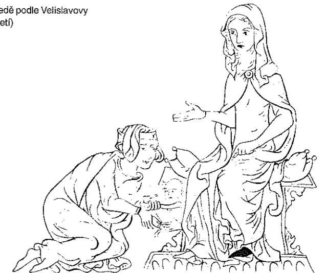
Vyobrazení porodu vsedě podle Velislavovy bible (polovina 14. století)

Vedle těchto úkonů se těhotným ženám doporučovala rozumná fyzická zátěž, často nezbytná pro chod domácnosti. Na Podblanicku se říkávalo: Žena, než začne rodit, má obilít světlici, upéci chléb a vyprat . Tvrdý život žen v chudších, zvláště horských oblastech se projevil i v těžších podmínkách při porodu. Např. v Rusavě na Valašsku musela chudobná robka, i když byla těhotná, dělat až do poslední chvíle všechno, mosela do hor – nekerá v horách to ztratila (tj. porodila) ,