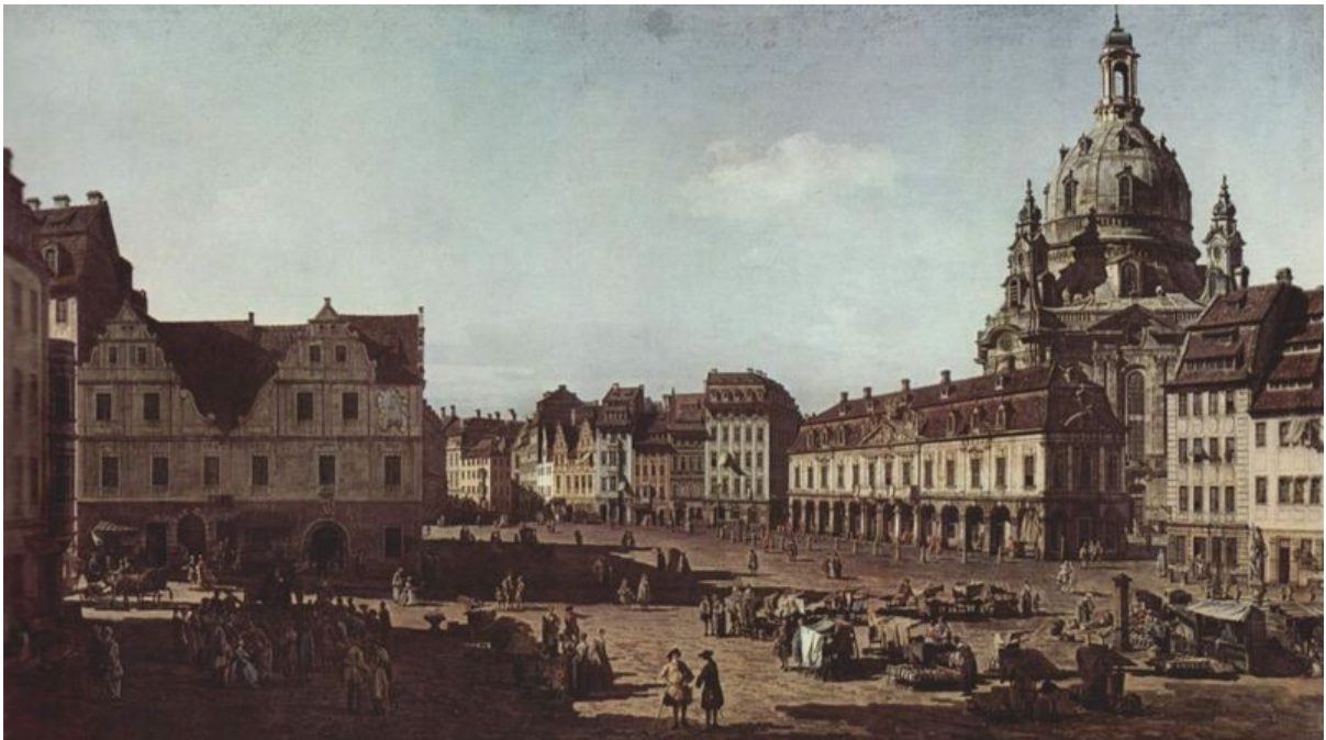
Veduta di Dresda con la Frauenkirche