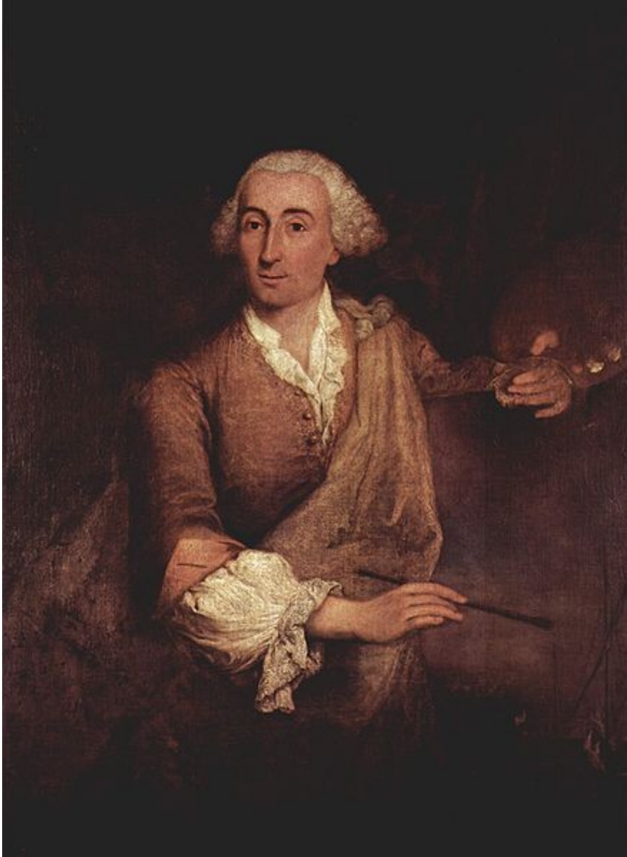
Francesco Guardi ( Venezia, 5 ottobre 1712 – Venezia, 1° gennaio 1793 )