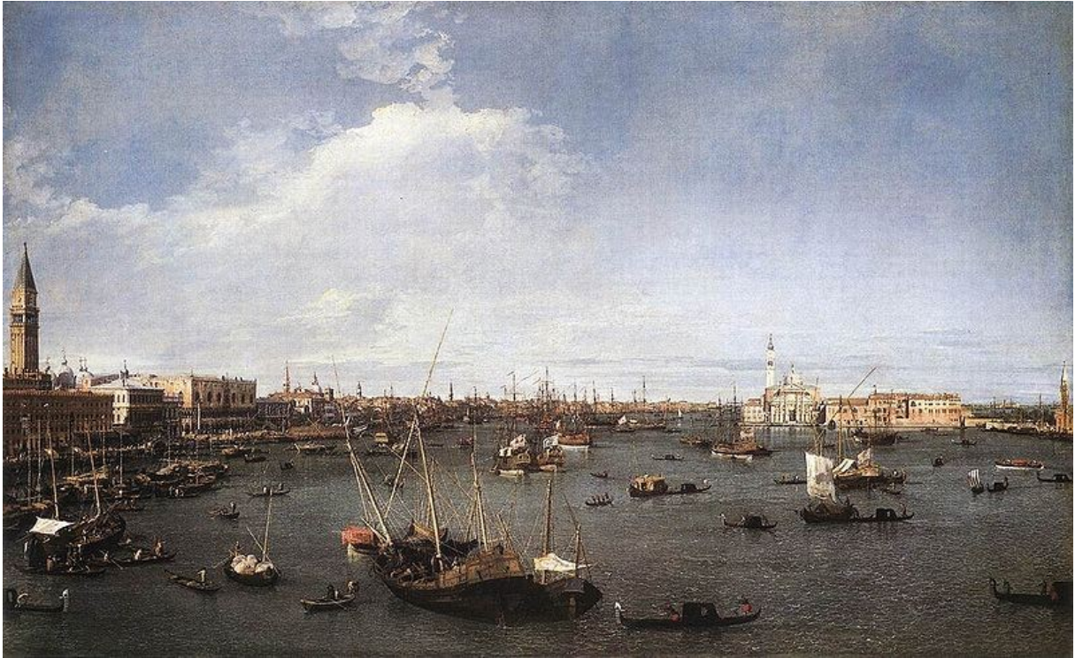
Il Bacino di San Marco