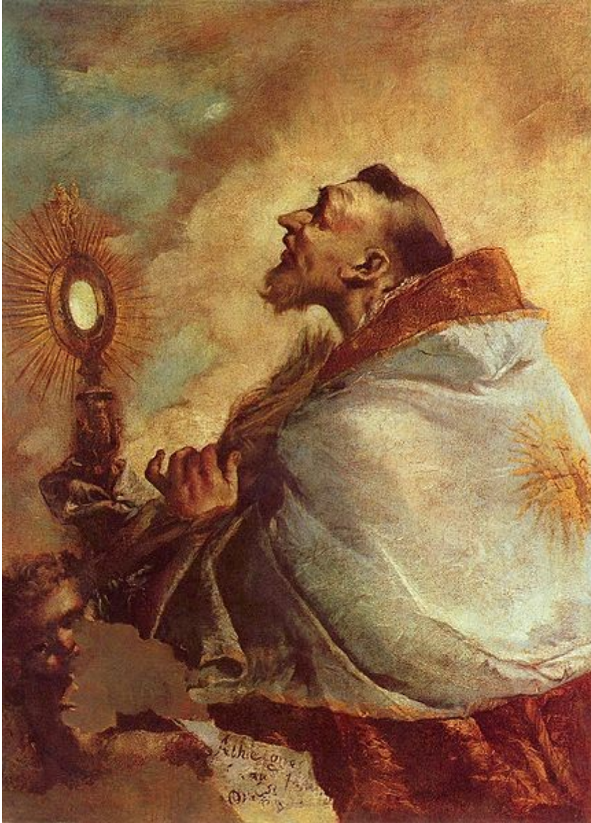
Santo adorante l'Eucaristia