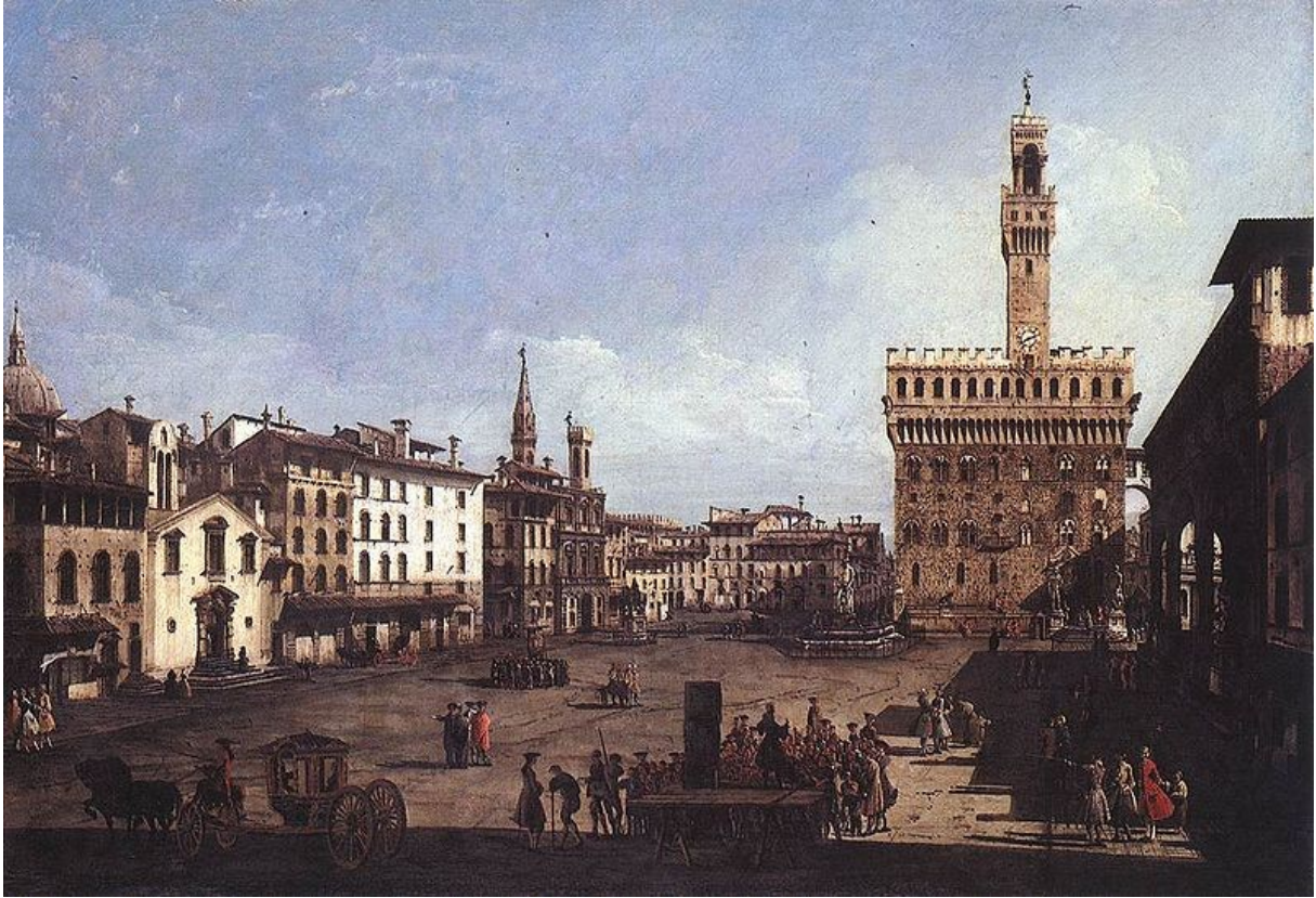
Piazza della Signoria a Firenze