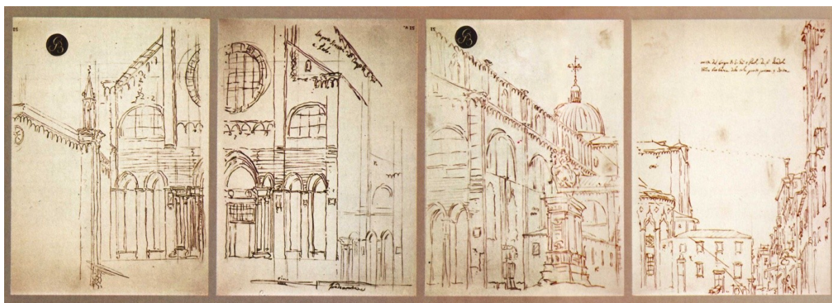
Canaletto : Basilica dei Santi Giovanni e Paolo , a Venezia . Veduta ottenuta accostando quattro fogli disegnati con l'aiuto di una camera oscura.