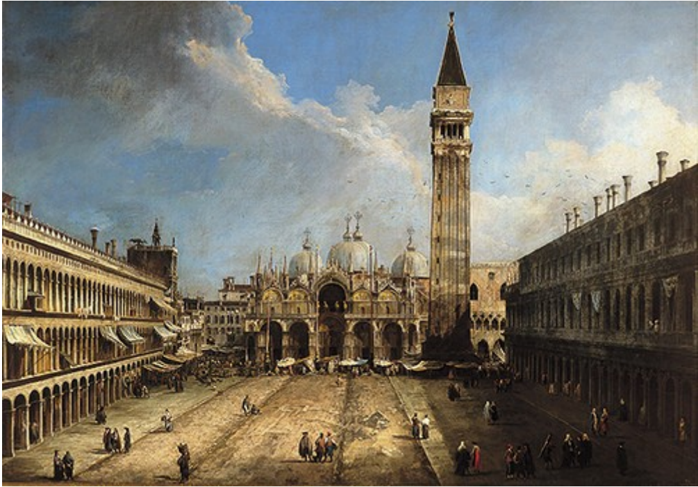
Piazza San Marco