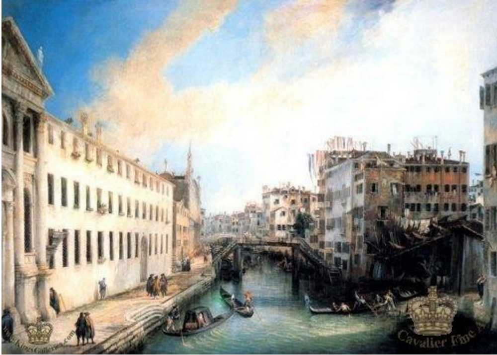
Rio dei Mendicanti