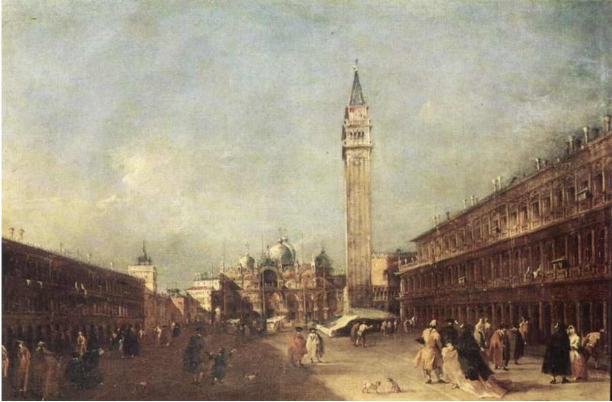
Piazza San Marco