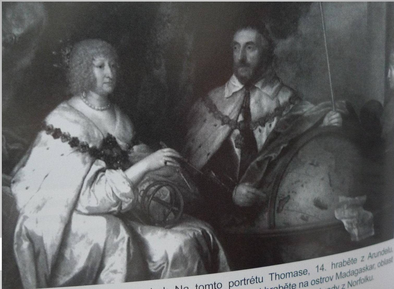
Na tomto portrétu Thomase, 14. hraběte z Arundelu, je zobrazen hraběte na ostrov Madagaskar, oblast z Norfolku.