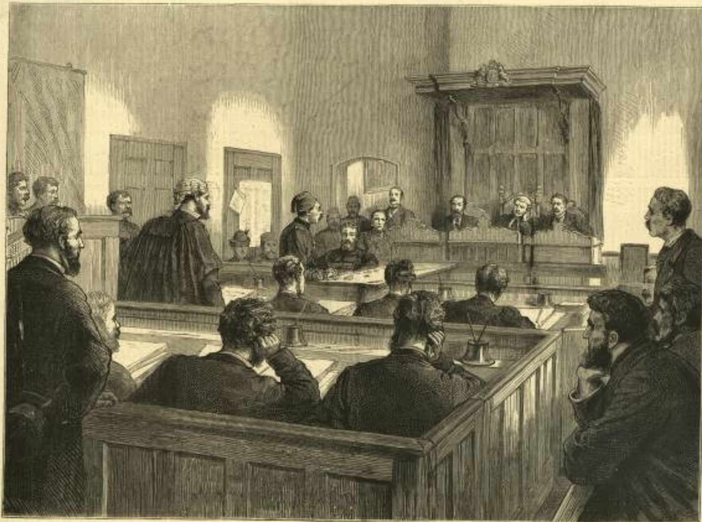
Apr. THE BRITISH CONSULAR COURT AT CONSTANTINOPLE 1878