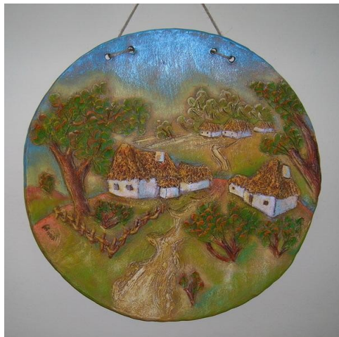
Плетение из лозы