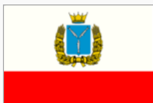
Флаг Саратовской области

Образована - 5 декабря 1936 года путём преобразования Саратовского края.