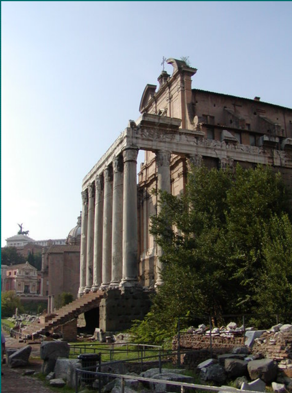
Chrám Antonina (císaře Antonia Pia) a Faustiny na Forum Romanum .