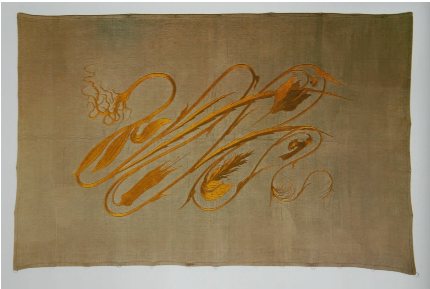
Hermann Obrist, Brambořík (Rána bičem), výšivka, cca 1895