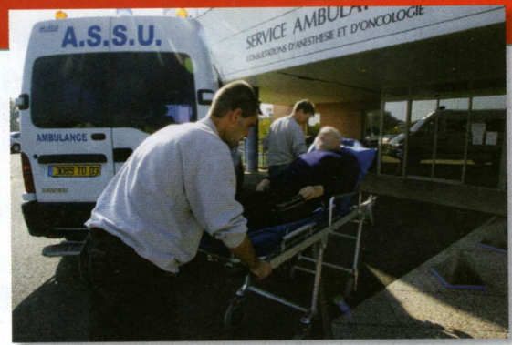
Une clinique est un hôpital privé. Les cliniques sont souvent aussi bien équipées que les hôpitaux. À Paris, on trouve surtout des hôpitaux .