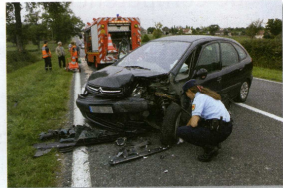
Les policiers (ou agents de police) s'occupent des villes ; les gendarmes s'occupent des campagnes et des routes.