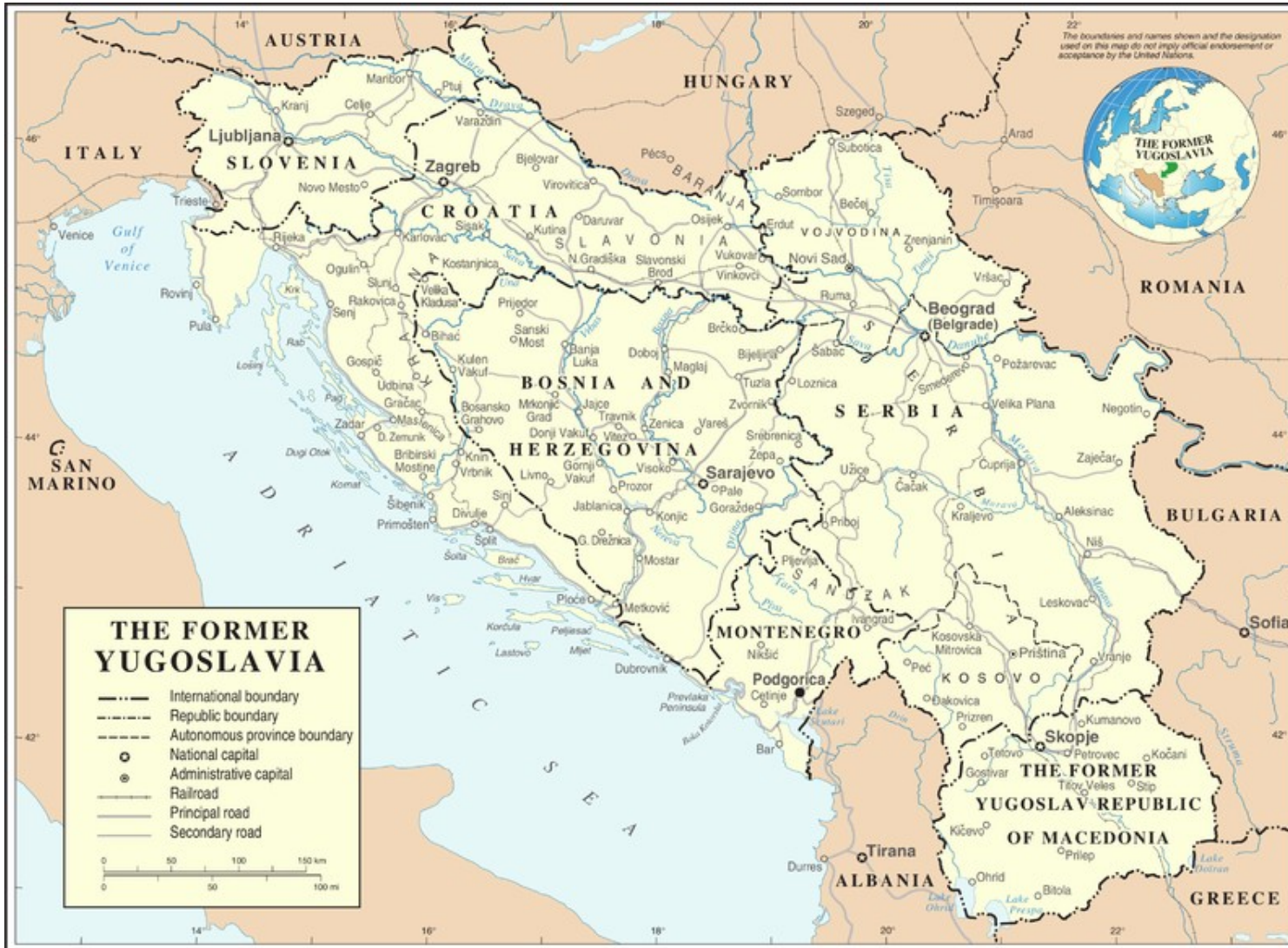
Ex-Joegoslavië: Slovenië, Kroatië, Bosnië en Hercegovina, Servië, Montenegro, Macedonië