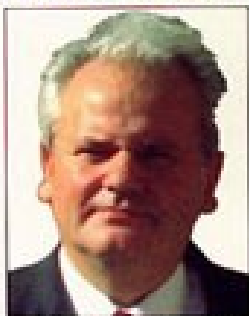
Slobodan Milosevic President of the Federal Republic of Yugoslavia

For genocide and crimes against humanity