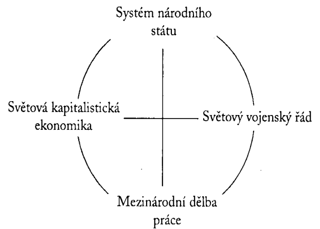
Schéma 2. Dimenze globalizace

2) systémy národních států. Světová ekonomika přináší 3) mezinárodní dělbu práce a celý systém je udržován pomocí 4) světového vojenského řádu. Dialektická povaha doby plyne právě z tendencí „tlaku a tahu“ národních států vstupovat do globálních systémů a udržovat si zároveň vlastní identitu.