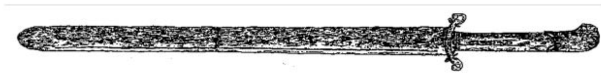
Obr. 1 – Tesák z Janoslavice (převzato z: Michna, P., 1997, obr. 1)

Bohužel se jedná o nedostatečně zpracovanou zbraň – zapříčiňuje to fakt, že na našem území nebyly nalezeny ani tři desítky kusů, a také absence starších nálezů, které jsou rozptýleny ve sbírkách muzeí a památkových objektů různých regionů. Z těchto důvodů ještě nebyla vytvořena obsáhlejší koncipovaná typologie.