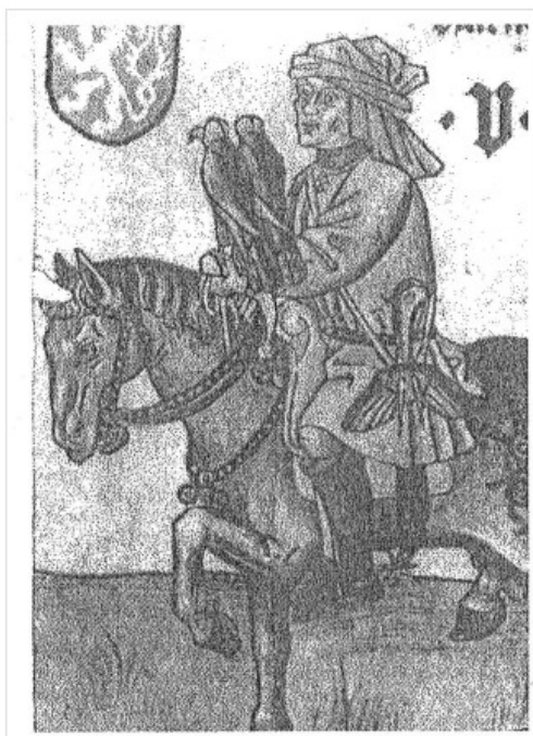
Obr. 5 – Hrací karta