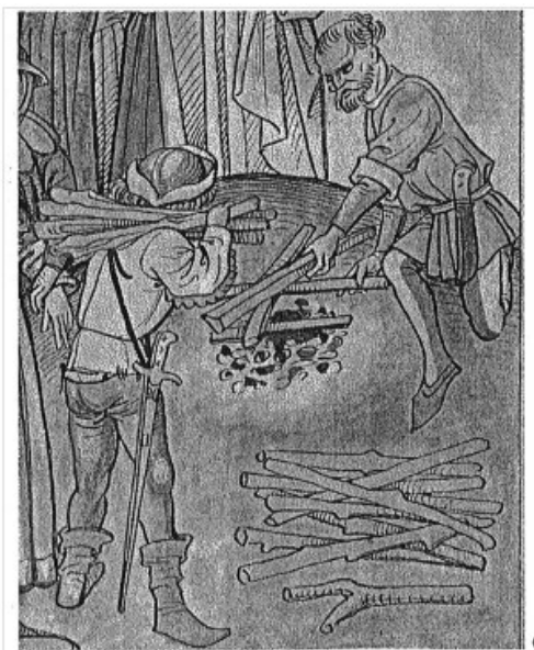
Obr. 4 - Reichenthalova kronika