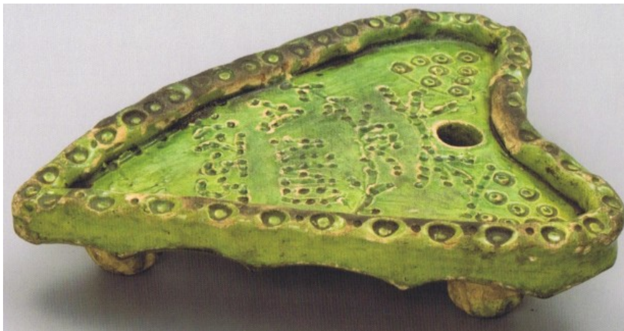
Srdcovitá podložka pod žehličku (?) na třech nožkách, hrncina, rytý dekor a nápis ANNO 1775

K vybavení domácnosti patřila řada dalších druhů keramiky jako například kruhové formy na pečení těsta (z nichž se později vyvinuly formy na bábovky), květináče, vázy, svícny, kahany, umývadla, nočníky, hračky aj.