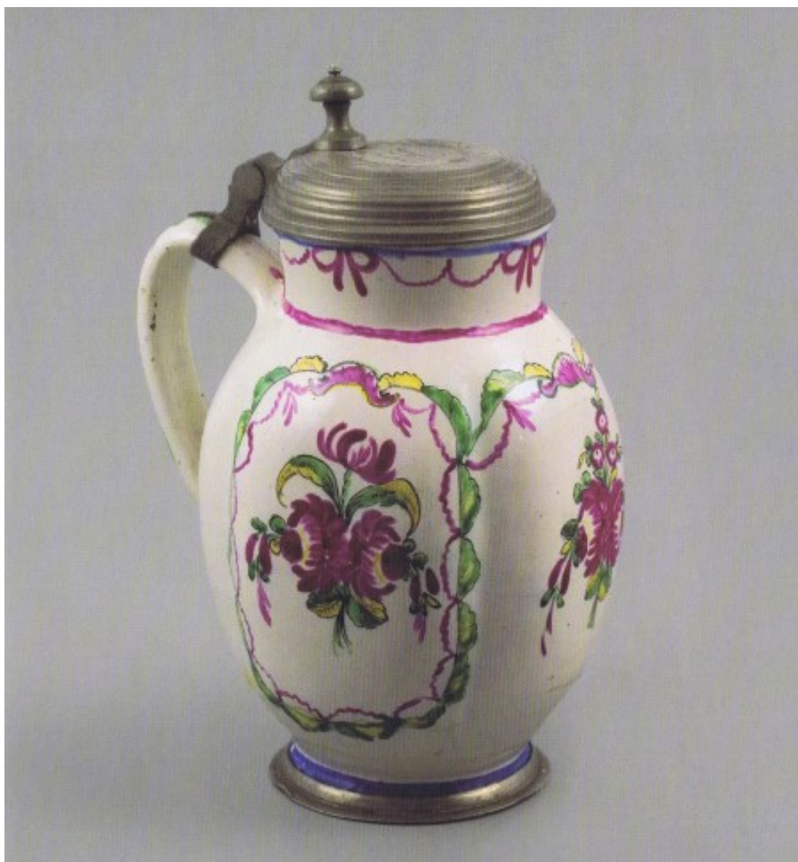
Fajánsový džbán s dekorem v muflových barvách, opatřený cínovým víčkem a monřází nohy, Vyškov (?), konec 18. století