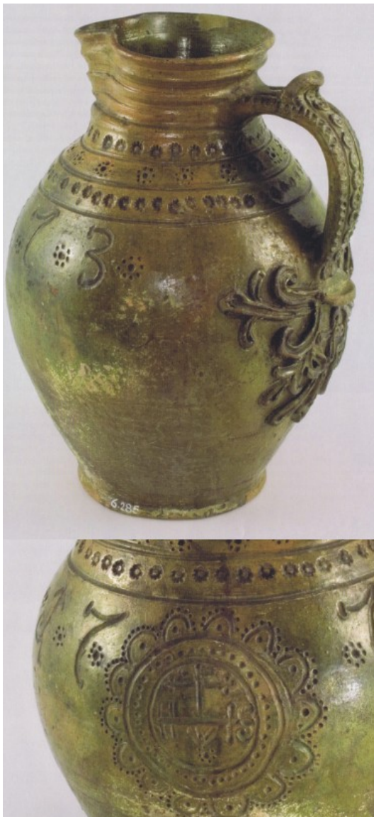
Reprezentativní džbán s hrdlem opatřeným hubkou, zdobený plastickým a rytým dekorem, hrnčina, 1773

Mezi nejvýraznější hrnčířské výrobky patřily džbány. V Muzeu města Brna se vyskytuje exemplář džbánu s trubicovitou výlevkou ze 17. století. Postupem času se ustálil hruškvitý tvar těla. Od 18. století bývá hrdlo džbánu více promodelováno a opatřeno hubkou k nalévání tekutiny. Obvykle se vyskytují reprezentativní kusy s nápadnou výzdobou odkazující dekorativními motivy, iniciály a letopočtem na svého majitele. V prostředí menších měst se vyskytují keramické džbány se znaky cechů, bohatší cechy si nechávaly zhotovit džbány z reprezentativnějších materiálů (např. cín).