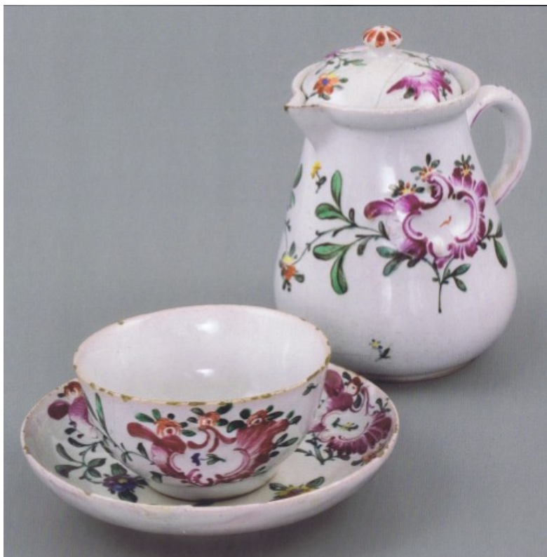
Fajánsová koncička a šálek s talířkem, součást soupravy na pití čaje, Holič, 1760 - 1770