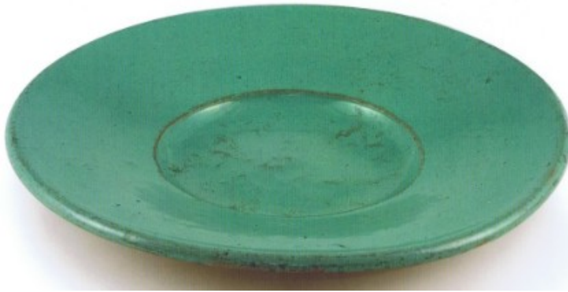
Talíř s širokým okrajem – majolika (?) 2. polovina 17. století

Mezi nejvýraznější hrnčířské výrobky patřily džbány. V Muzeu města Brna se vyskytuje exemplář džbánu s trubicovitou výlevkou ze 17. století. Postupem času se ustálil hruškvitý tvar těla. Od 18. století bývá hrdlo džbánu více promodelováno a opatřeno hubkou k nalévání tekutiny. Obvykle se vyskytují reprezentativní kusy s nápadnou výzdobou odkazující dekorativními motivy, iniciály a letopočtem na svého majitele. V prostředí menších měst se vyskytují keramické džbány se znaky cechů, bohatší cechy si nechávaly zhotovit džbány z reprezentativnějších materiálů (např. cín).