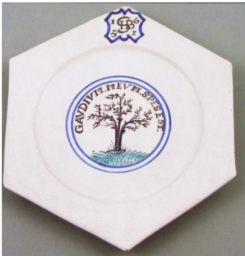
Plochý talíř šestibokého tvaru, novokřtěnská (habánská) fajáns patrně západoslovenského původu, 1651