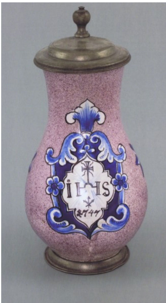
Manganem stříkaný fajánsový džbánek, opatřený cínovým víkem a montáží nohy, patrně Vyškov, 1747