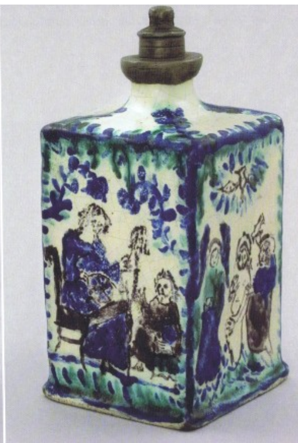
Čtyřboká fajánsová láhev s cínovým šroubovým uzávěrem, zdobená malovaným dekorem ve vysokožárných barvách představující světecké postavy, patrně Morava, kolem poloviny 18. století