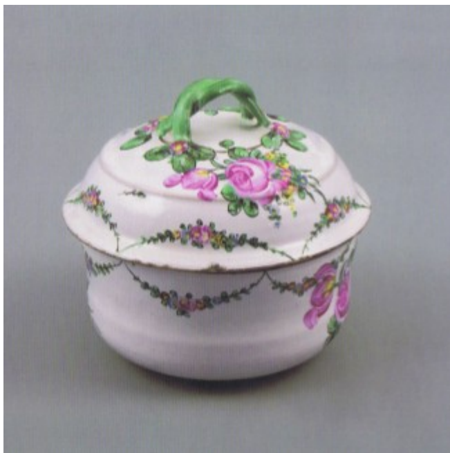
Dóza (cukřenka?) s víčkem opatřeným fitomorfní úchytkou, měkká kamenina s dekorem malovanými muflovými barvami, Hranice, kolem 1790