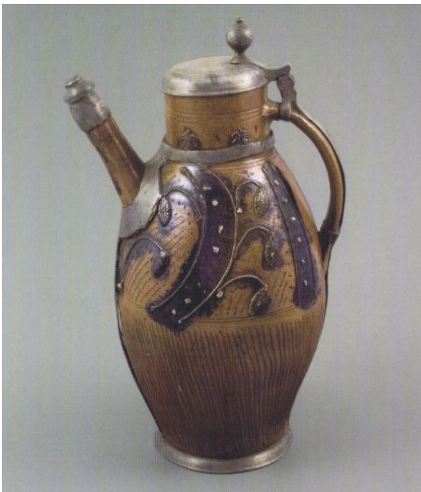
Vysoký džbán s trubicovitou výlevkou a cínovou montáží, tvrdá kamenina, plastický a rytý dekor ztvárněný tmavohnědou kresbou, solná glazura, Dolní Lužice (Muskau), konec 18. století