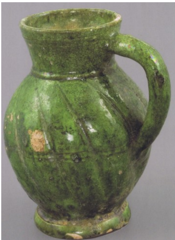
Soudkovitý džbánek s diagonálně žebrovanou stěnou – majolika (?) polovina 17. století

Největší skupinu keramických produktů tvořila široká škála hrnčiských výrobků, jejichž tvary se z praktických důvodů často neměnily ani v 19. a na počátku 20. století. Velká část zboží byla glazovaná průhlenou glazurou na barevném ostřepí anebo přímo glazurou barevnou. Výzdoba byla tvořena jednoduše, často geometrickou malbou, rytím, otisky a reliéfními nálepy. Ojediněle se v prostoru města Brna nachází také majolika z 2. poloviny 17. století, která stojí na pomezí mezi vyspělou keramikou a fajánsovými výrobky.