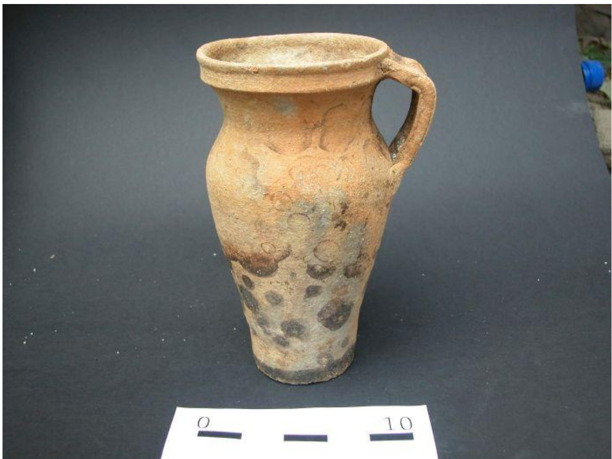
Jeden z typických zástupců pozdně středověké keramiky - pohár tzv. pražského typu - 15. století.