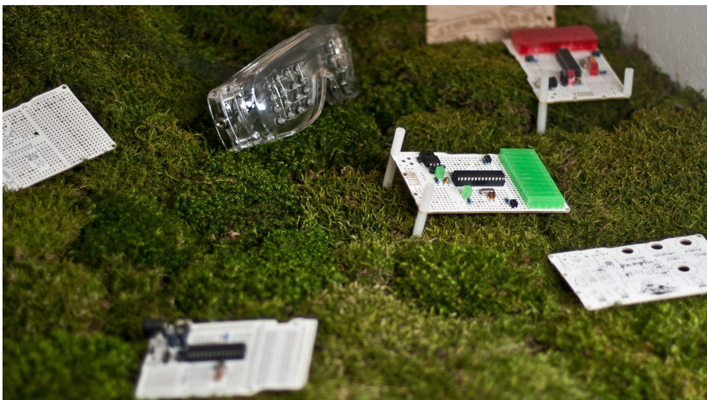
Aranžmá pracovního stolu 1.