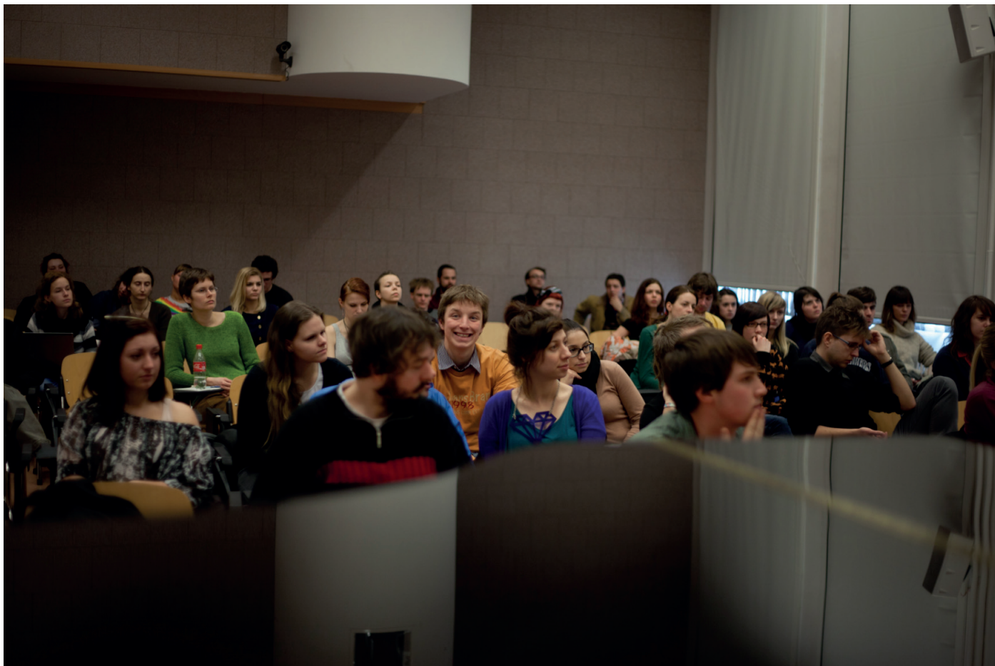
Přednášky se zúčastnilo asi 60 studentů a pedagogů Ústavu hudební vědy MU.