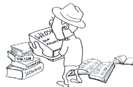
uczyć się języków obcych