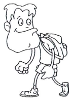
chodzić na spacer (na siłownię, do kina, do restauracji)