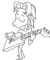
grać na gitarze