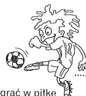
grać w piłkę