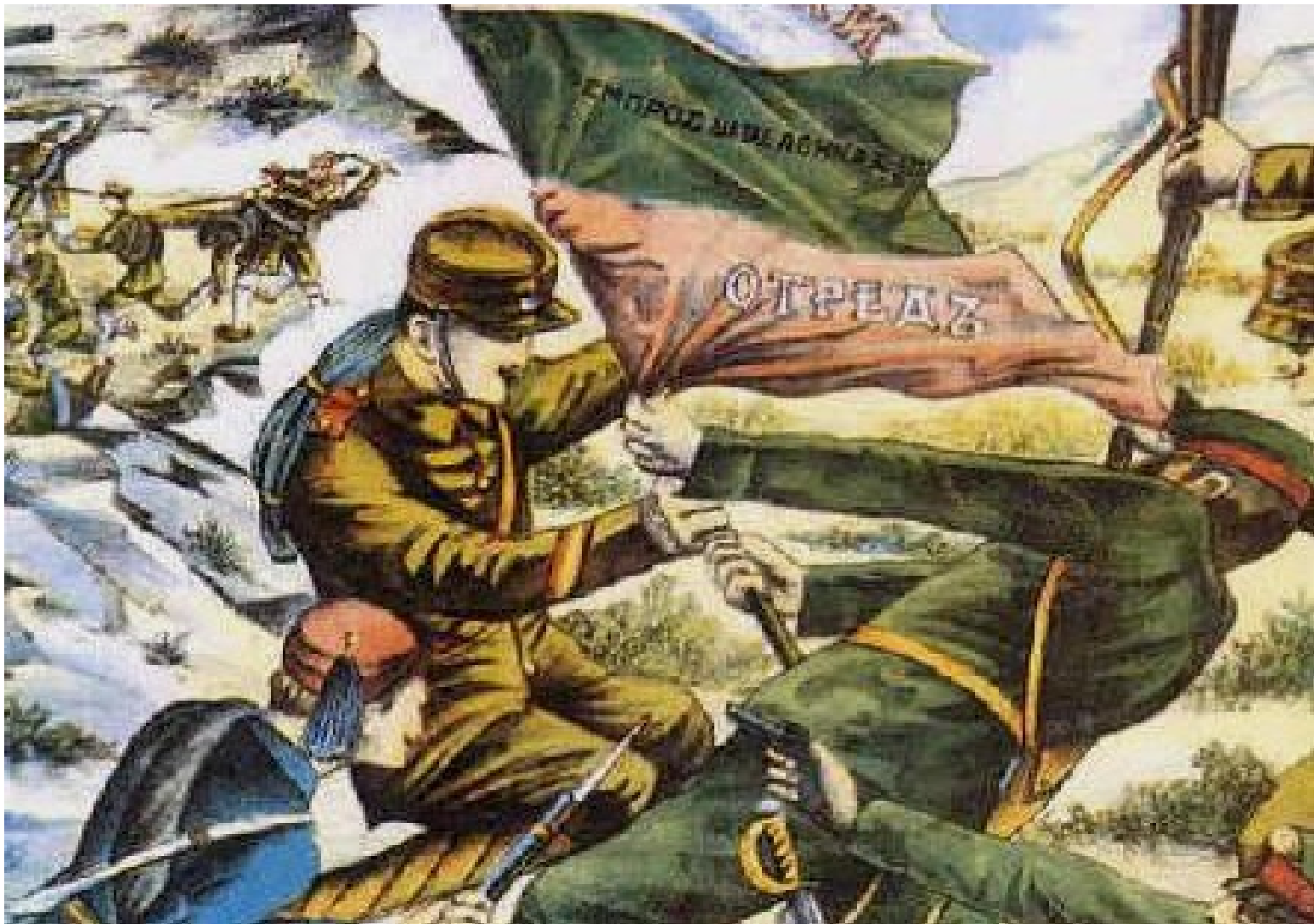
Druhá balkánská válka, boje na řece Strymonu, řecký voják se snaží ukořistit bulharskou zástavu