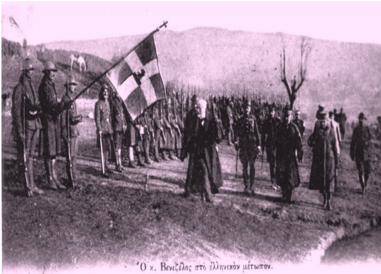
Premiér E. Venizelos na soluňské frontě, rok 1917