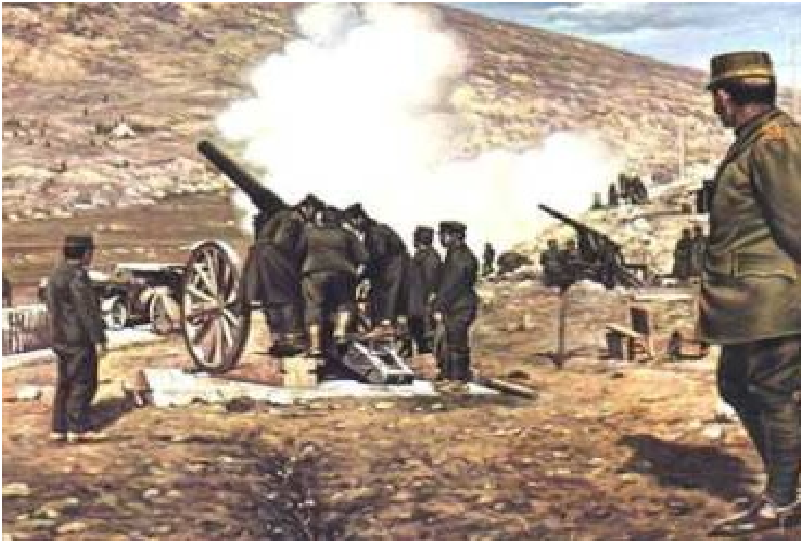
Na epirské frontě