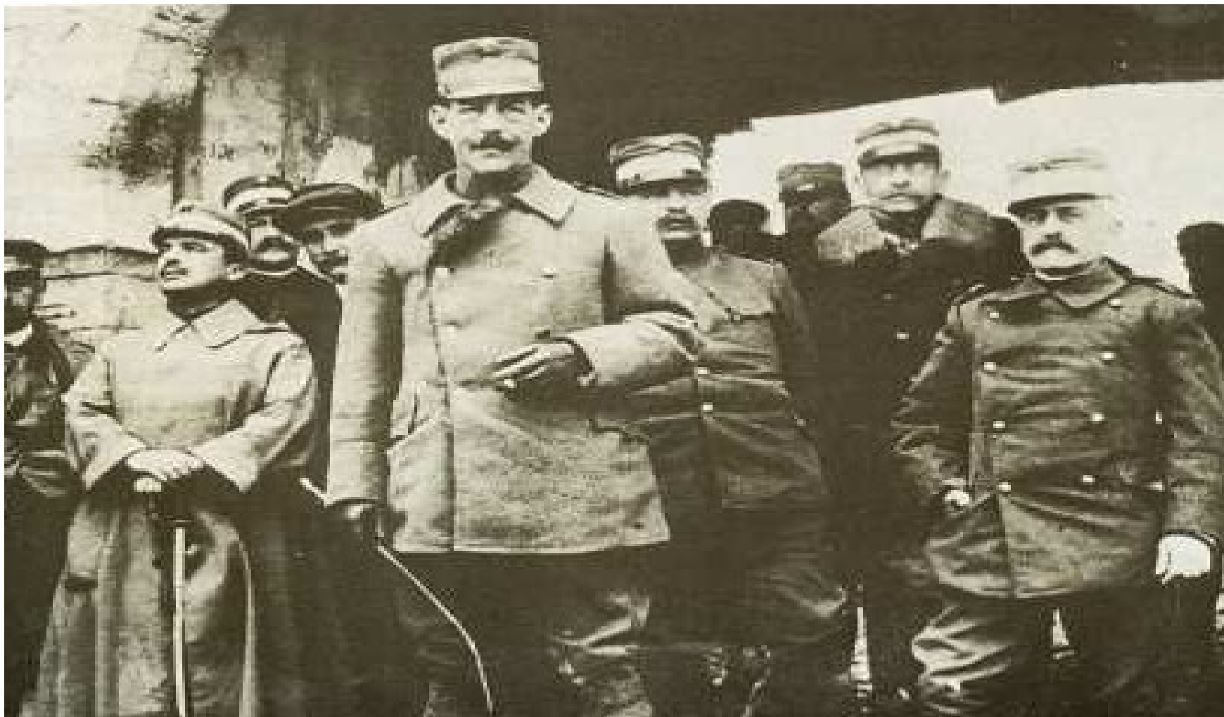
Princ Konstantinos v Řeky obsazené Janině, hlavním městě Epiru