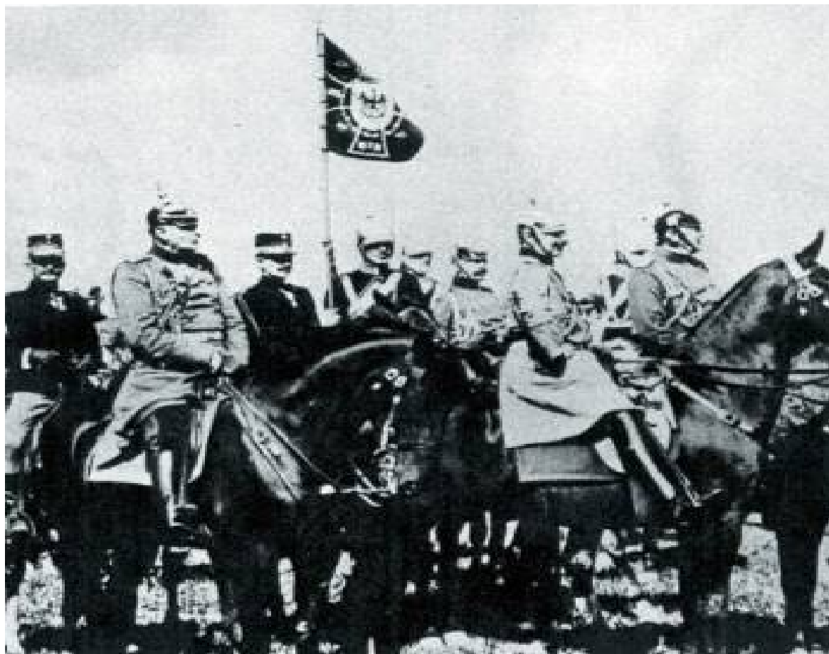
Král Konstantinos (zcela vlevo) ve suitě německého císaře Viléma II., nedatováno