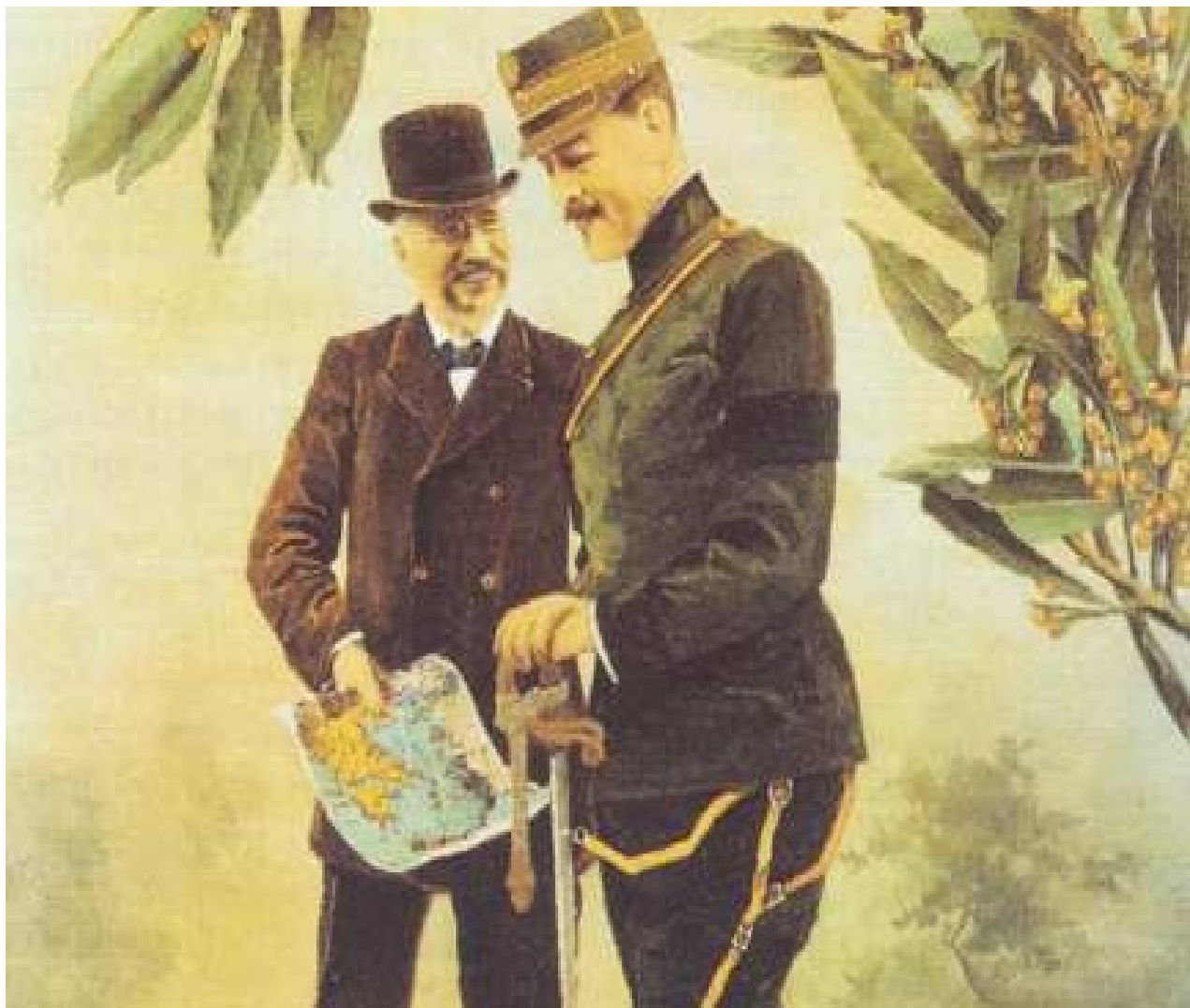
Předstíraná idylka: princ Konstantinos a premiér Venizelos