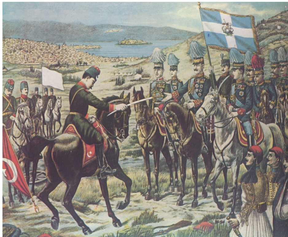
Vojenský velitel Janiny předává město Řekům