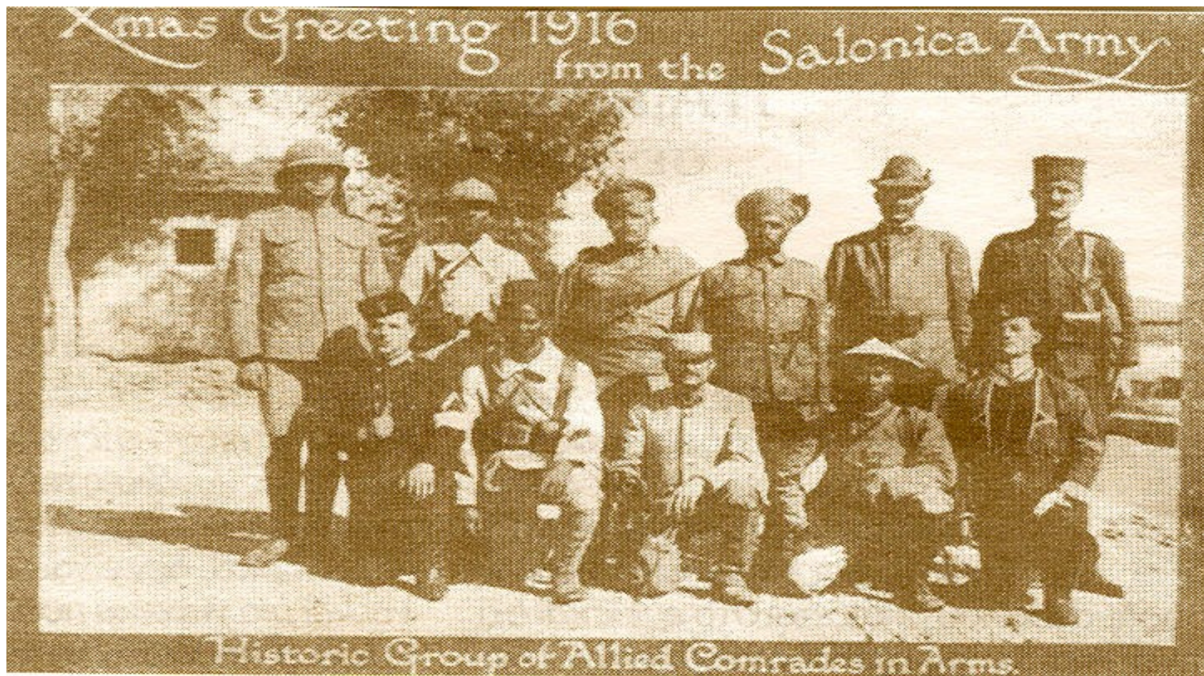
Příslušníci spojeneckých vojsk, která obsadila Soluň a okolí v roce 1916