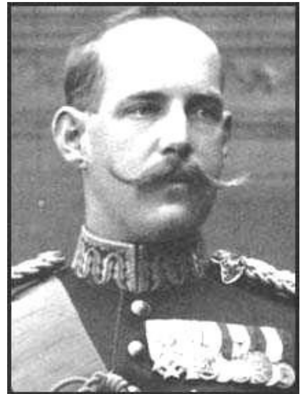
Nový král Konstantinos