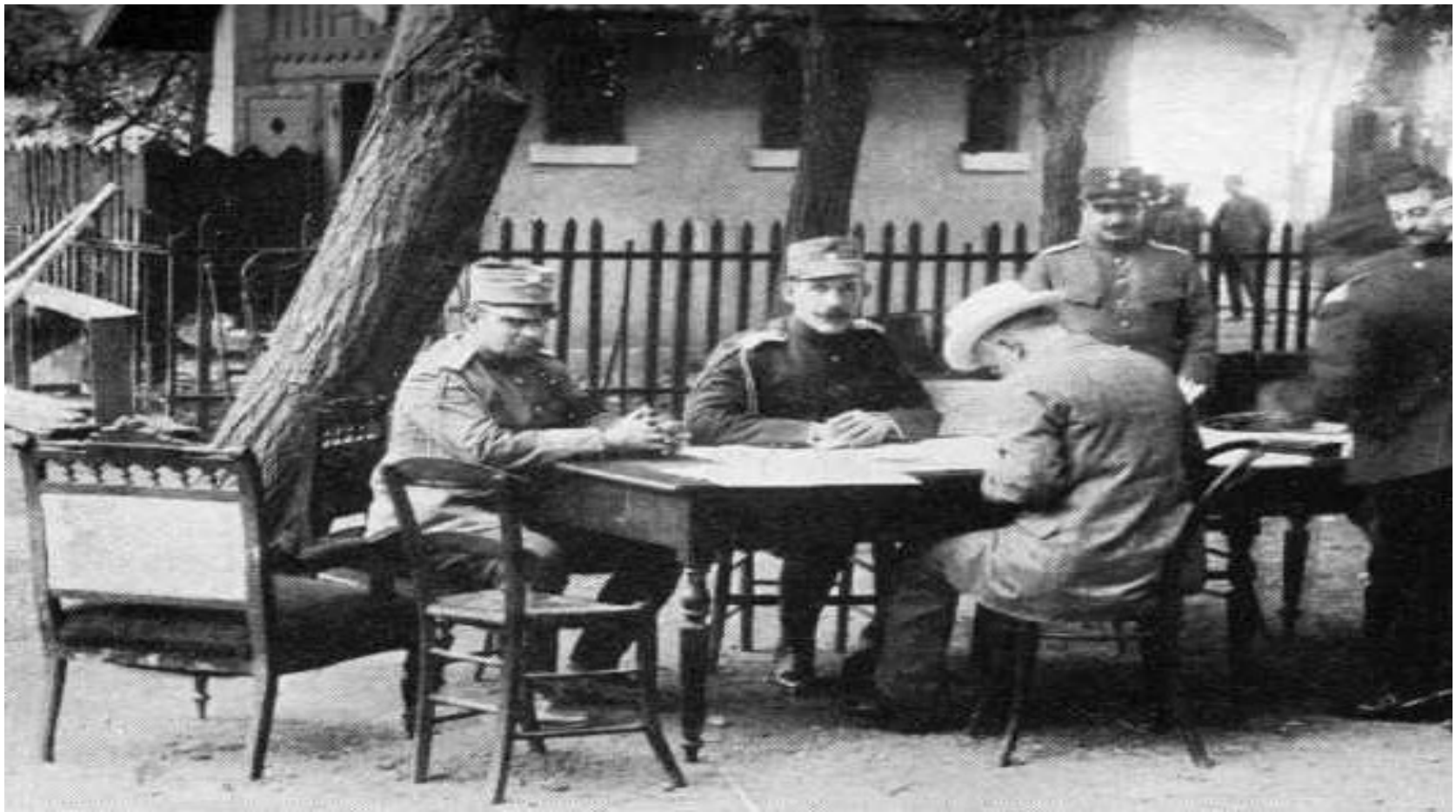
Princ Konstantin (sedící uprostřed) coby vrchní velitel řecké armády se svým štábem a El. Venizelem (v bílém klobouku), podzim 1912.