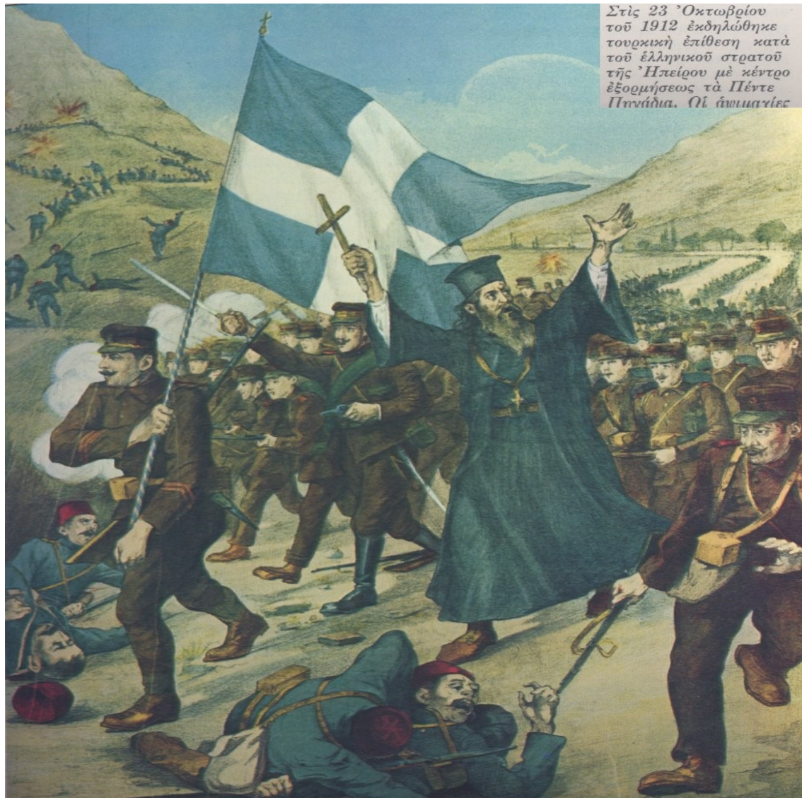
Řecký útok u Pende Pigadia v Epiru, podzim 1912. Lidový obraz