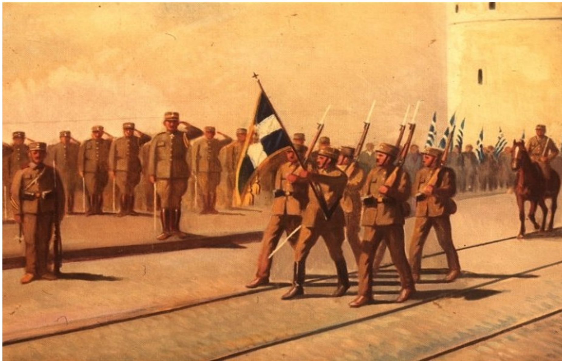
Vojenská přehlídka po dobytí Soluně