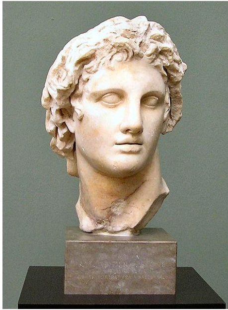
Alexandr Veliký (Μέγας Αλέξανδρος ο Μακεδών ο Τρίτος)

(mezi 20. a 30. červencem 356 př. n. l. v Pelle – 10. nebo 11. června 323 př. n. l. v Babylóně)