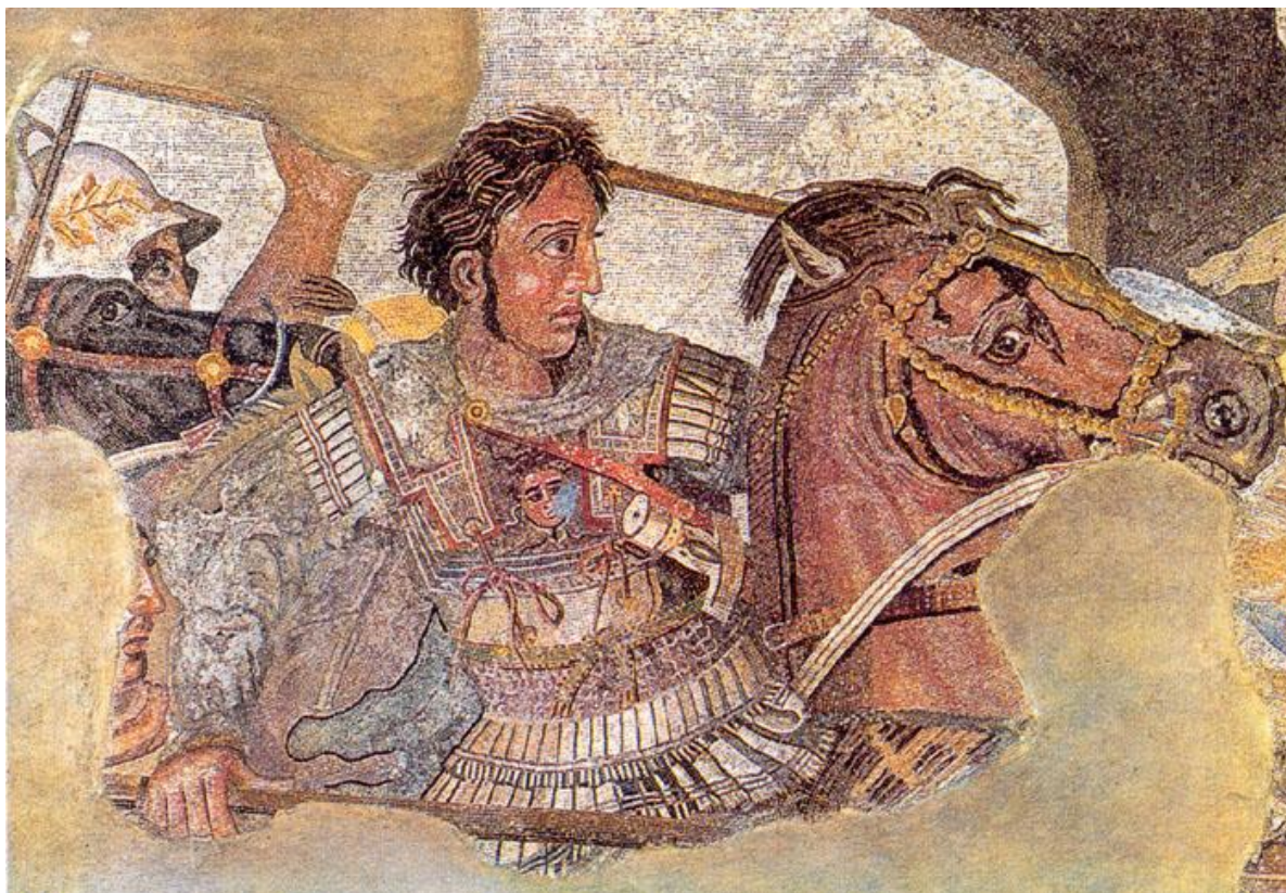
Alexandr v bitvě u Issu. (proti Dareiovi v listopadu roku 333 př. n. l.). Detail mozaiky. Pompeje.