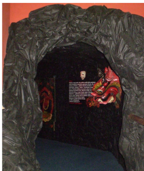
Dalajlama meditující ve stúpě a vstup do tibetského pekla.