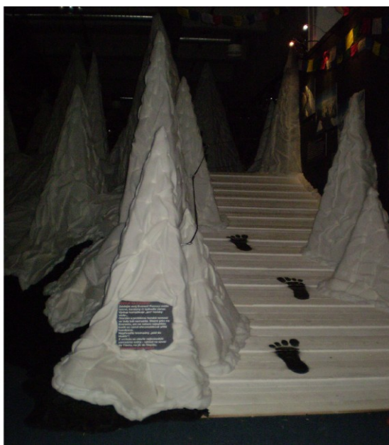
Lahev s vodou z Mont Everestu, kterou najdete pod ledovým masivem a vstup na dobrodružnější cestu chemlonovými Himalájemi.