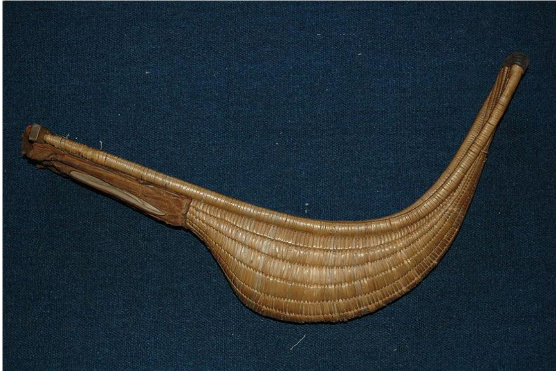
Cesta - raketa ve tvaru proutěného košíku