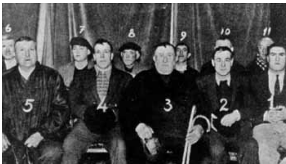
Prvé majstrovstvá bertsolaris

2. Súťaže a majstrovstvá, kde improvizátori súťažia pred porotou, ktorá im neskôr udelí ocenenie. Tieto súťaže majú rozličné úrovne, od detských, mládežníckych až po krajské; za najdôležitejšiu udalosť sa považuje Campeonato de Euskal Herria (Majstrovstvá Baskicka), ktorá sa koná každé štyri roky.