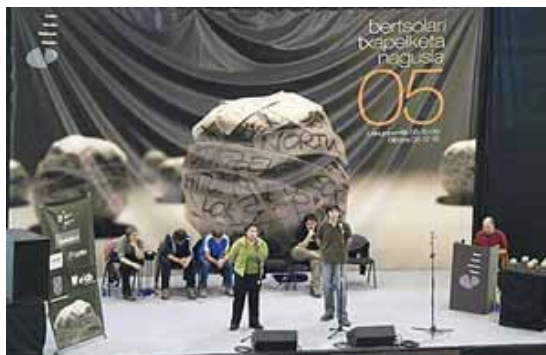
Majstrovstvá bertsolaris 2005