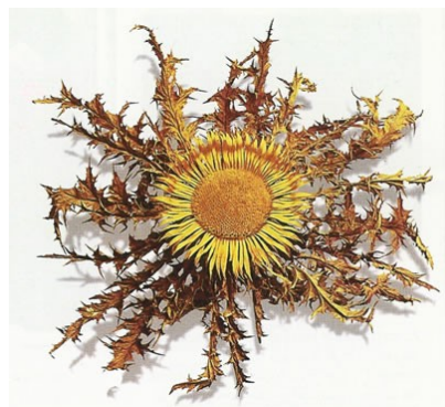
Mikelats, Atarrabi a Deabrua

Toto náboženství vyznávalo trojici magických bytostí a to Mari a její dva synu Atarrabi (ztělesnění dobra) y Mikelats (ztělesnění zla), ze kterých vznikali další bohové a duchové tak dobří jako ti zlí.