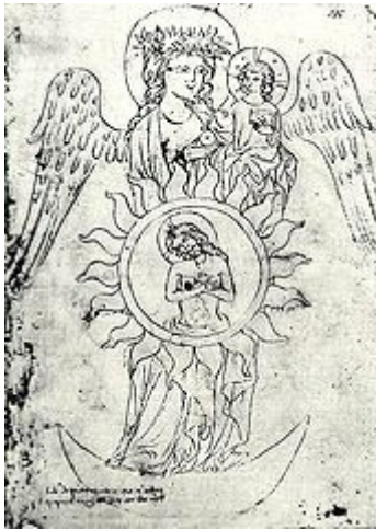
Liber depictus aneb Krumlovský obrazový kodex.