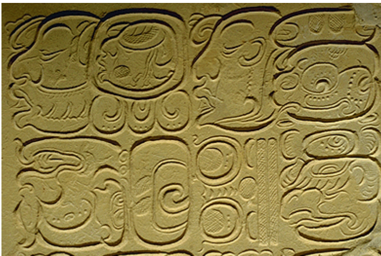
Zápis v mayském jazyce.