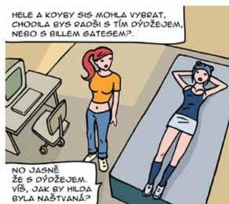
Hana a Hana.