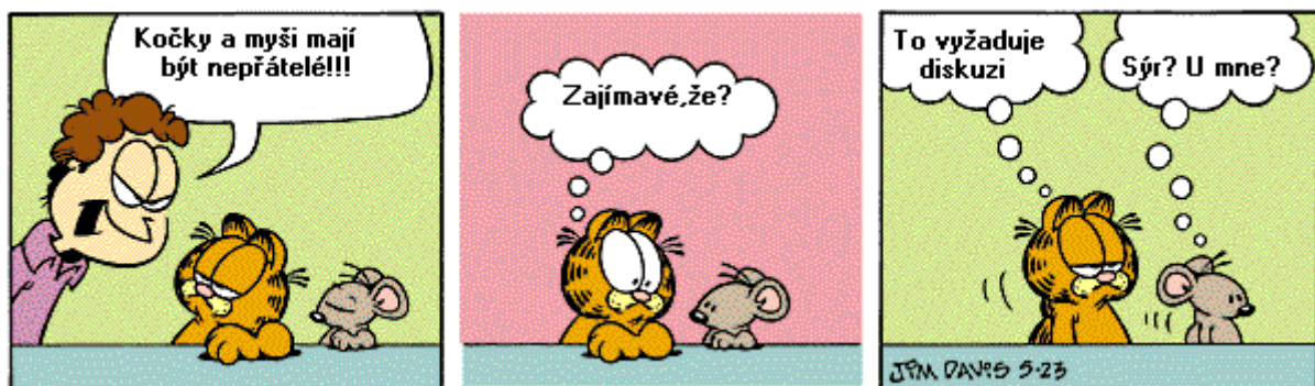
Novinový strip –Garfield.