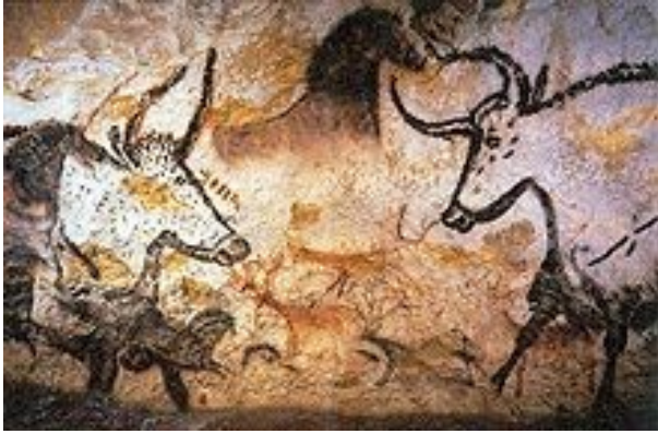
Nástěnné malby z jeskyně v Lascaux .