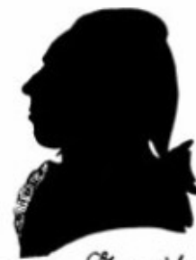
Charles Stamitz. v. 22 Jan: 1789.