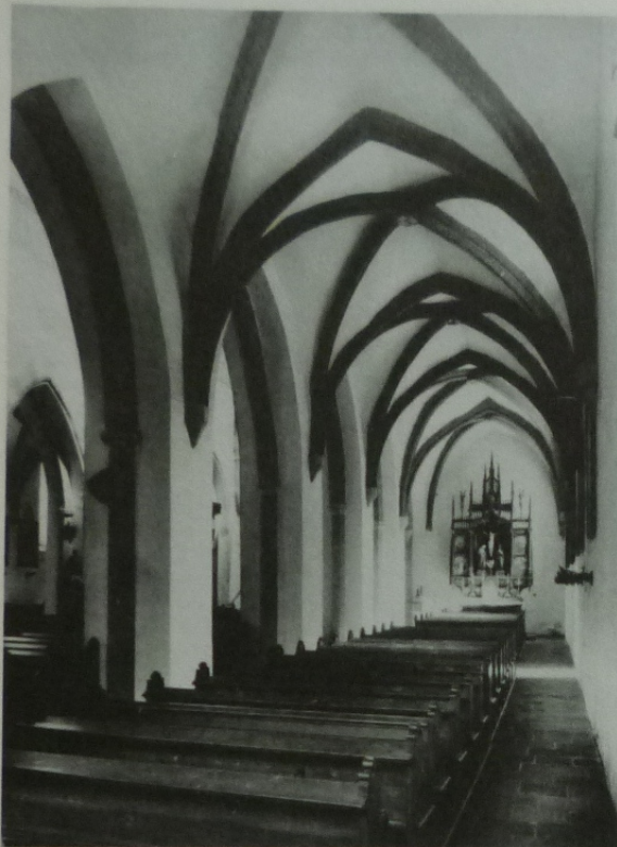
Police nad Metují. Klášterní kostel Nanebevzetí P. Marie – pohled do jižní boční lodi.

Příznačné je zde široké uplatnění mnohostěnných tvarů, užívaných v česko-moravské architektuře ve větším měřítku už od druhé čtvrtiny, zvláště pak ve třetí čtvrti 13. století. Tak tu spatřujeme polygonální přípory v presbytáři, polygonální pásy nesoucí záklenky arkád a triumfální oblouk, mnohostěnnou formu mají i jehlancové konzoly v bočních lodích a na nich spočívající bloky náběžných štítků, ve kterých koření klenební žebra. Tím kostel v Polici připomíná některé starší česko-moravské stavby i díla pocházející z doby po polovině 13. století (např. stavby písecko-zvíkovské huti z padesátých a první poloviny šedesátých let).