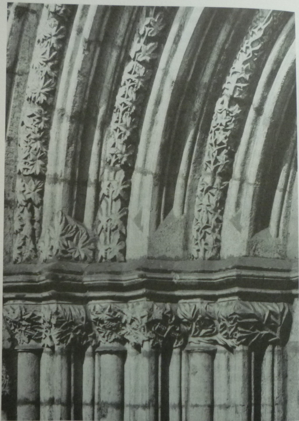
Police nad Metují. Klášterní kostel Nanebevzetí P. Marie – západní portál, detail.