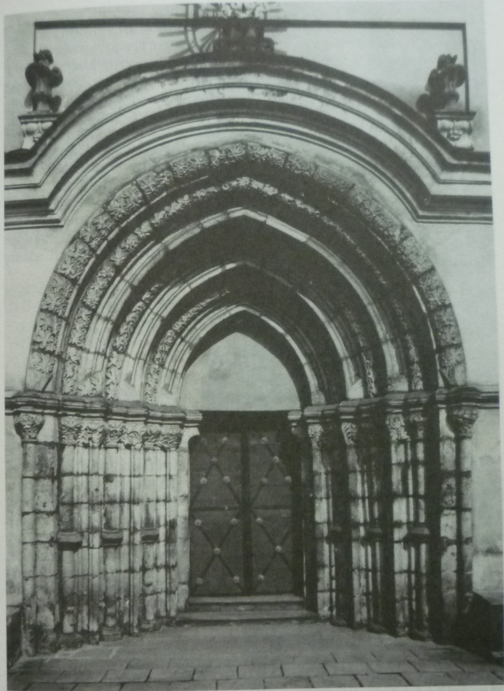
Police nad Metují. Klášterní kostel Nanebevzetí P. Marie – západní portál.