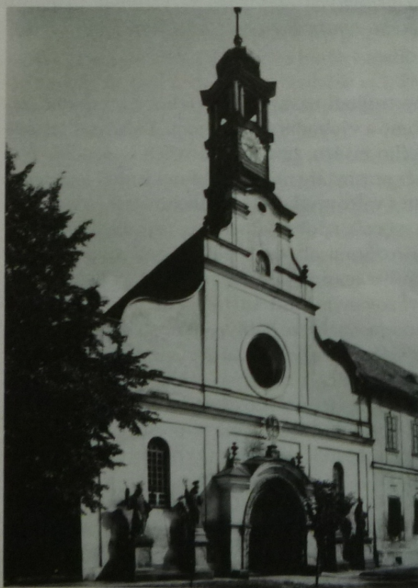
Police nad Metují. Klášterní kostel Nanebevzetí P. Marie – západní průčelí.