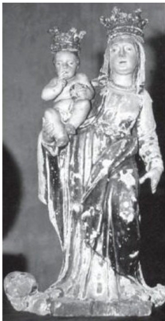
Obr. 11. Madona, Počeradý, kostel sv. Anny.