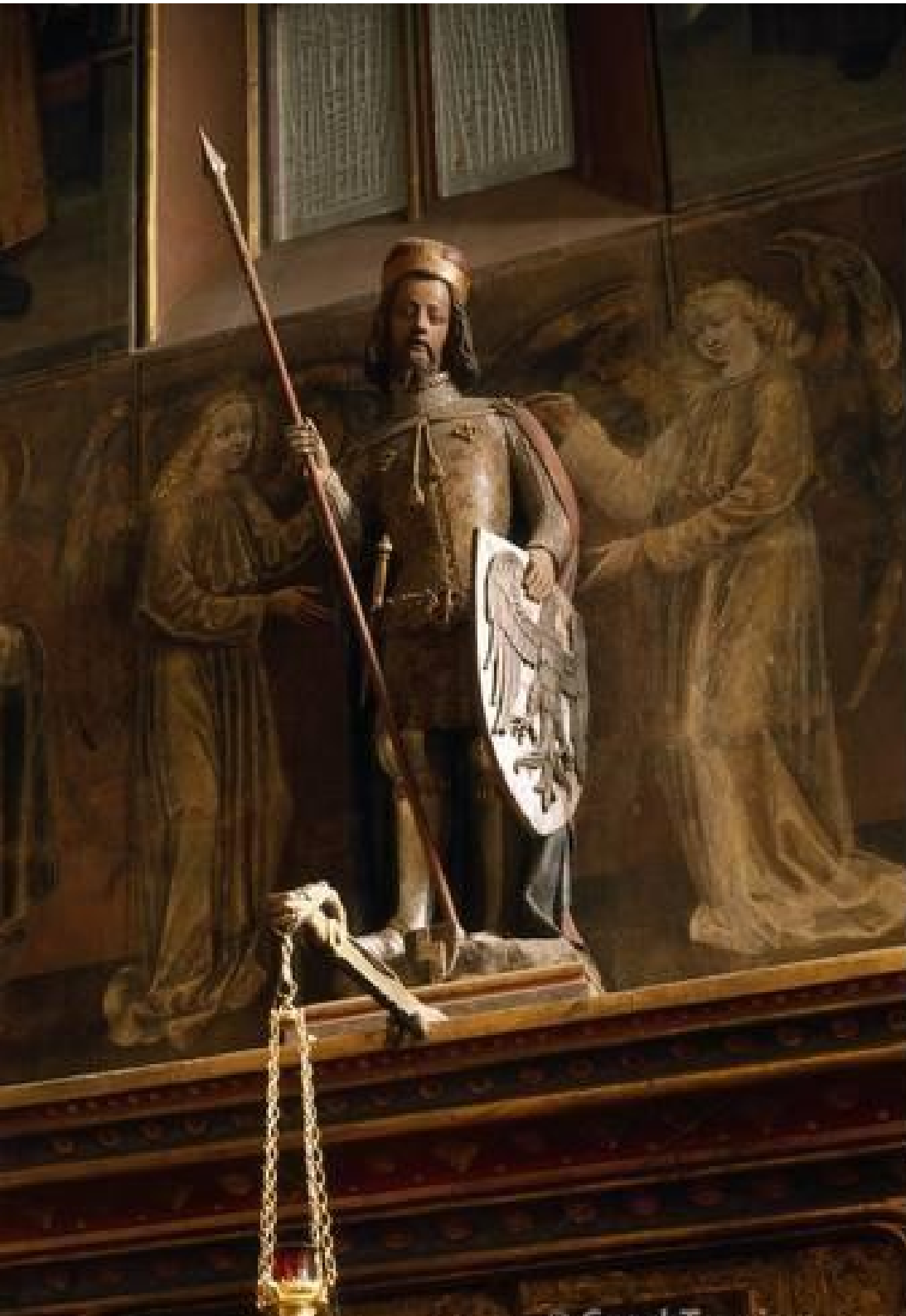
Petr Parlář (?): Sv. Václav (1372?)