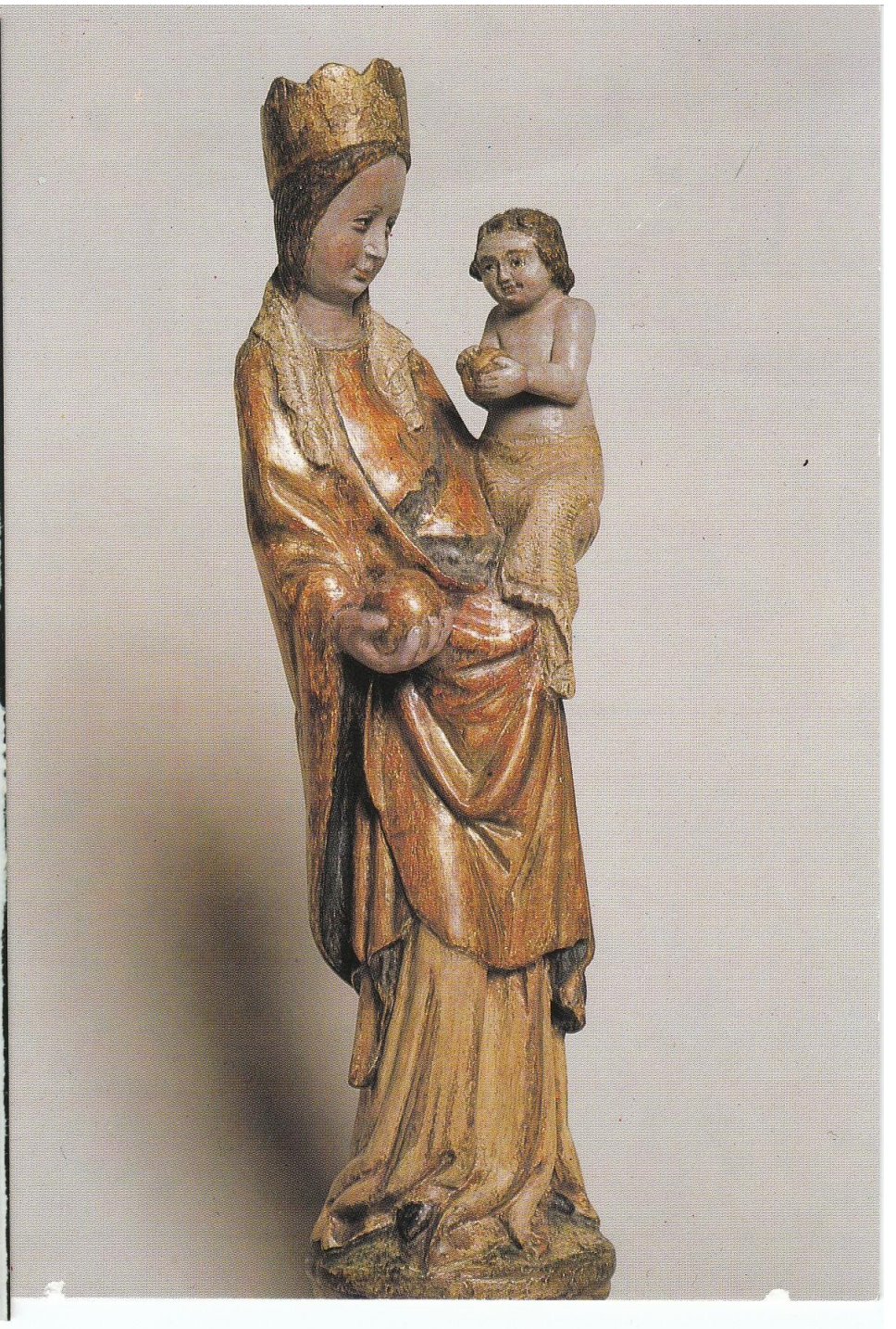
Hejnická Madona, 80. léta 14. století