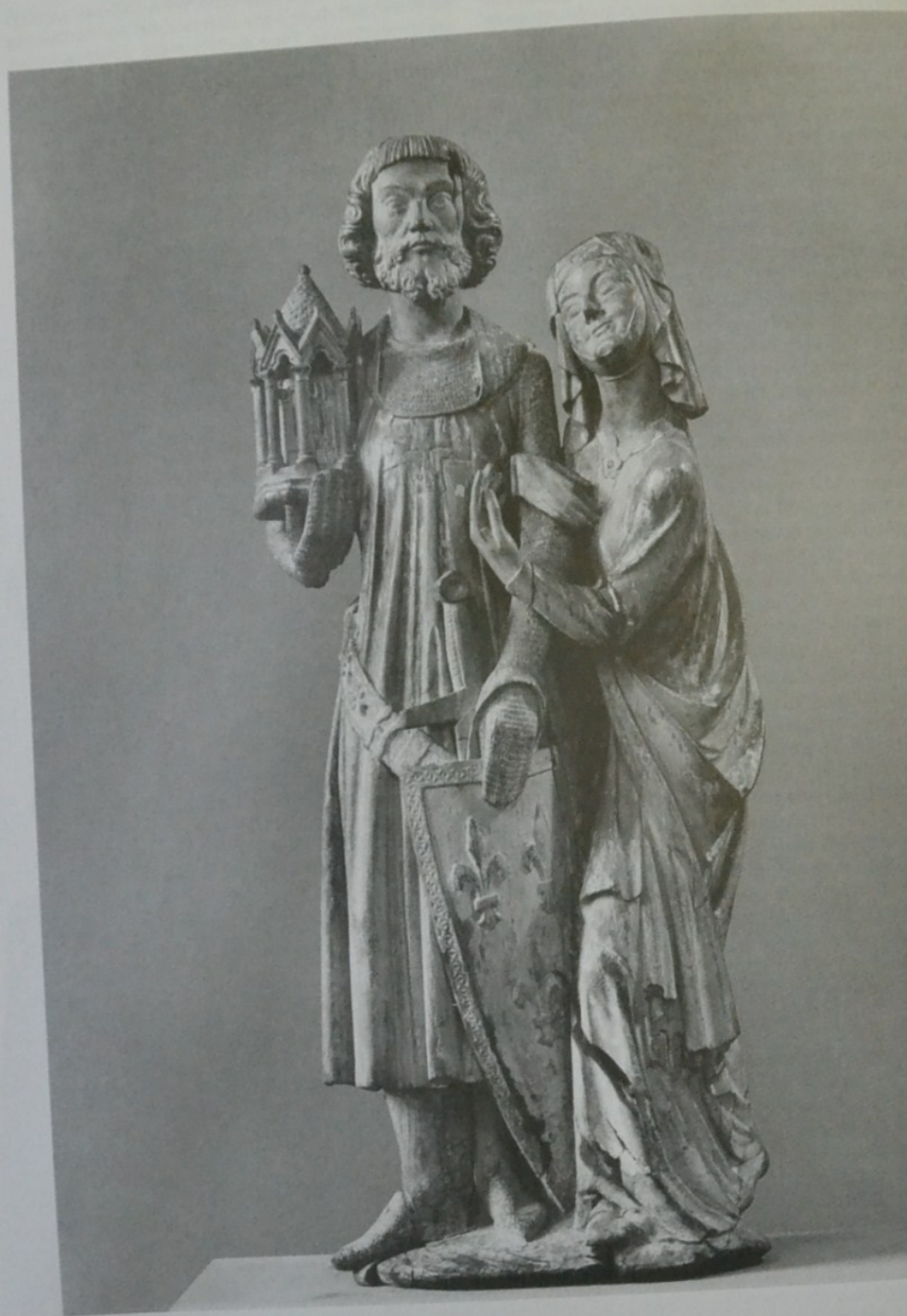
19/ Ludwig IX. als Kreuzfahrer und seine Gemahlin Margarethe von der Provence 19. Jahrhundert

Eichenholz, Privatbesitz in Berlin