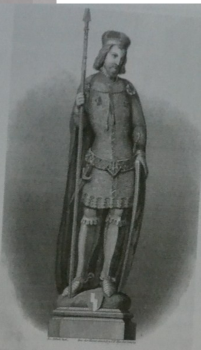
SV VACLAV SV WENZEL