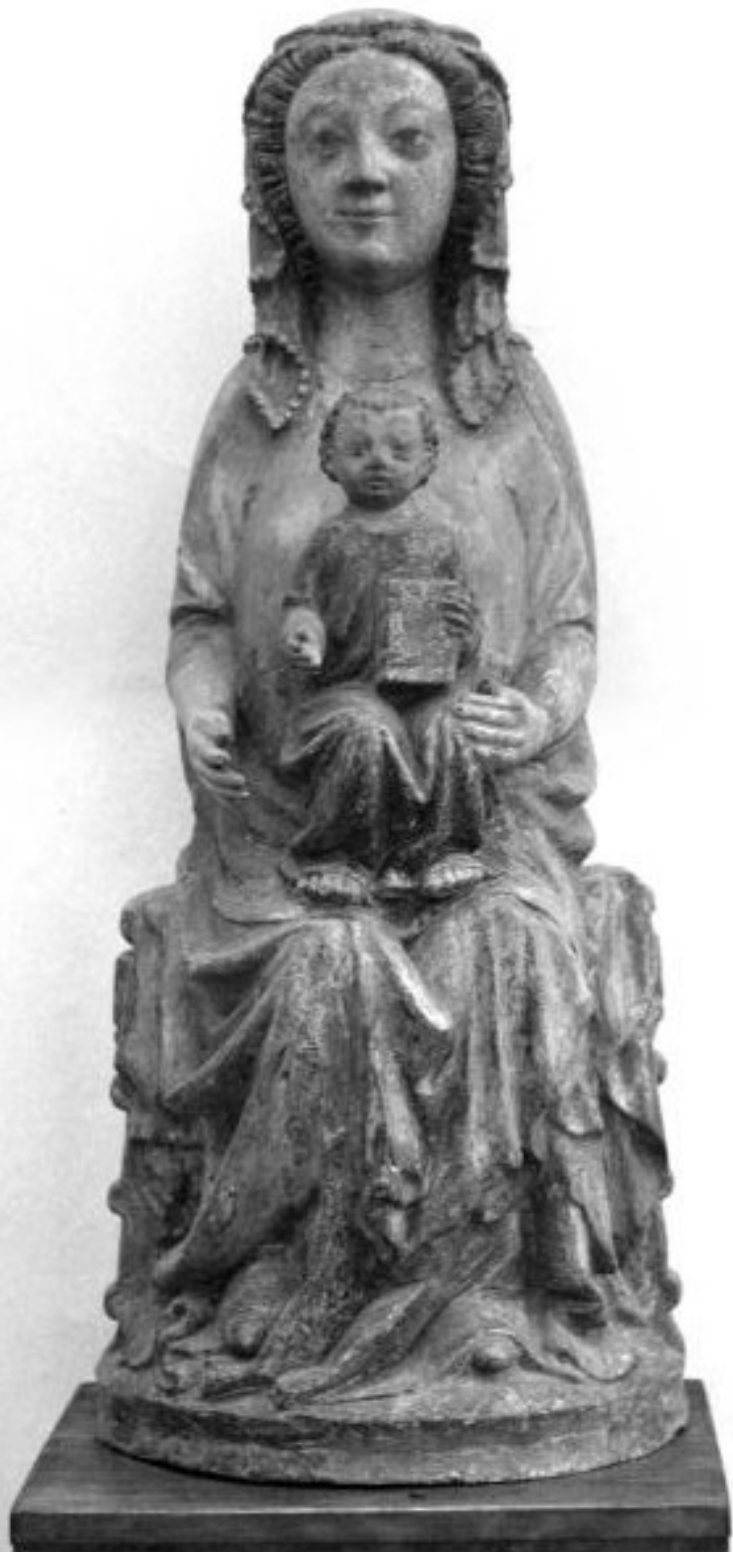
Madona z Kamenné Hory (Kammiena Góra), 1. třetina 14. století