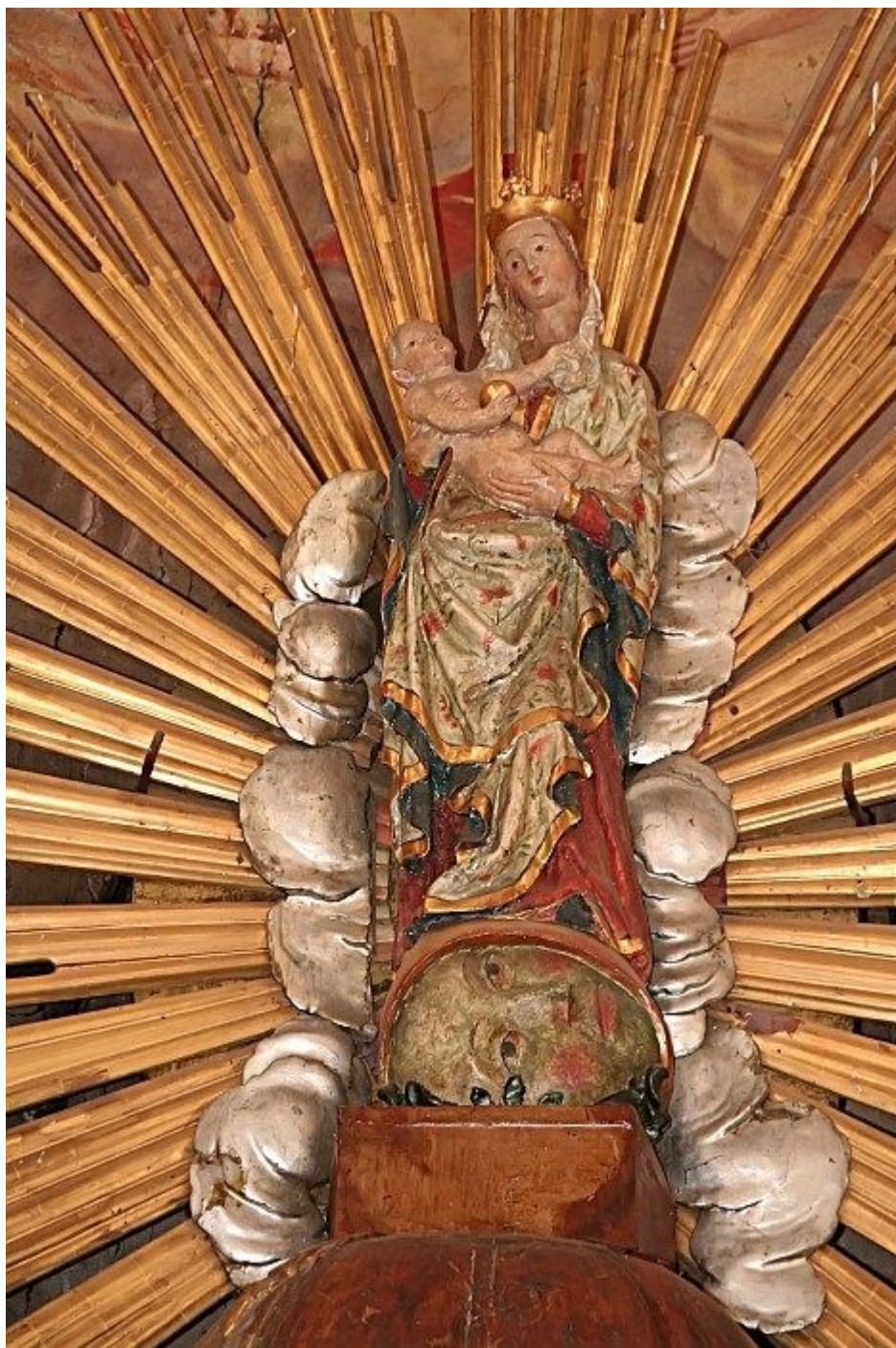
Tismická Madona, pův. po 1400 odcizena 1990, v kostele kopie