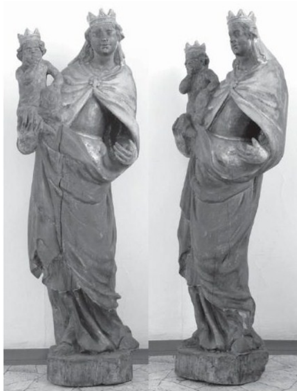
Obr. 13, 14. Madona, Muzeum města Ústí nad Labem.