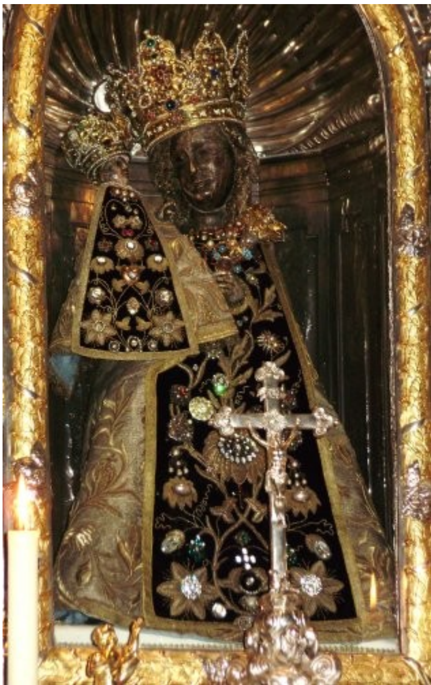
Madona z Altöttingu, kol. 1300