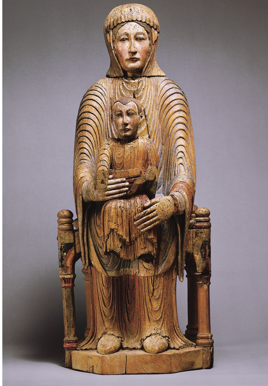
Sedes Sapientiae, 12. století