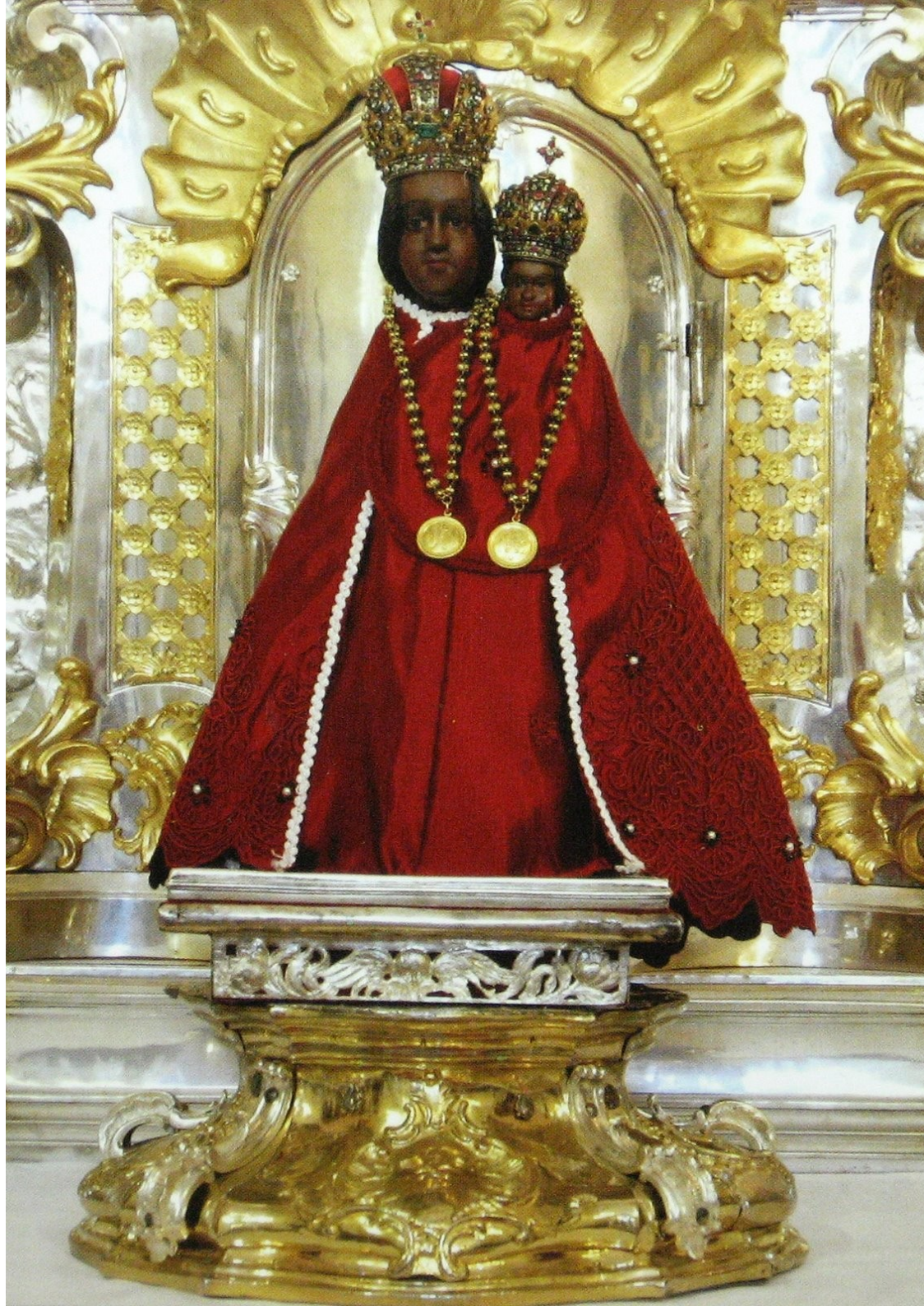
Madona svatohorská (kol. poloviny 14. století)