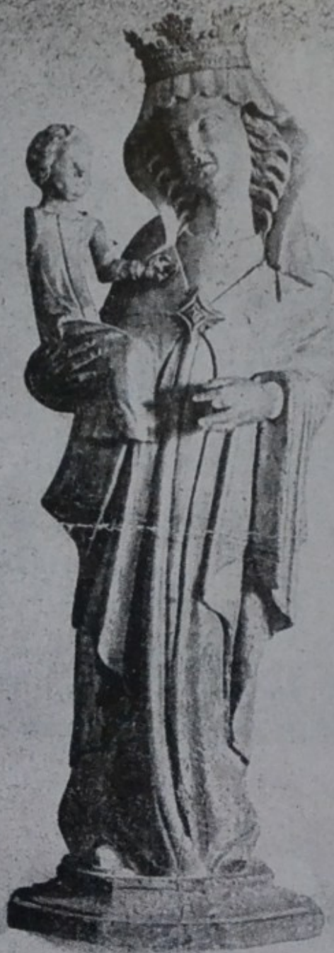
3/ Nápodoba Altöttinské madony. Velké Losiny, zámek. Kaple. Sáznek Ivo Hlobil