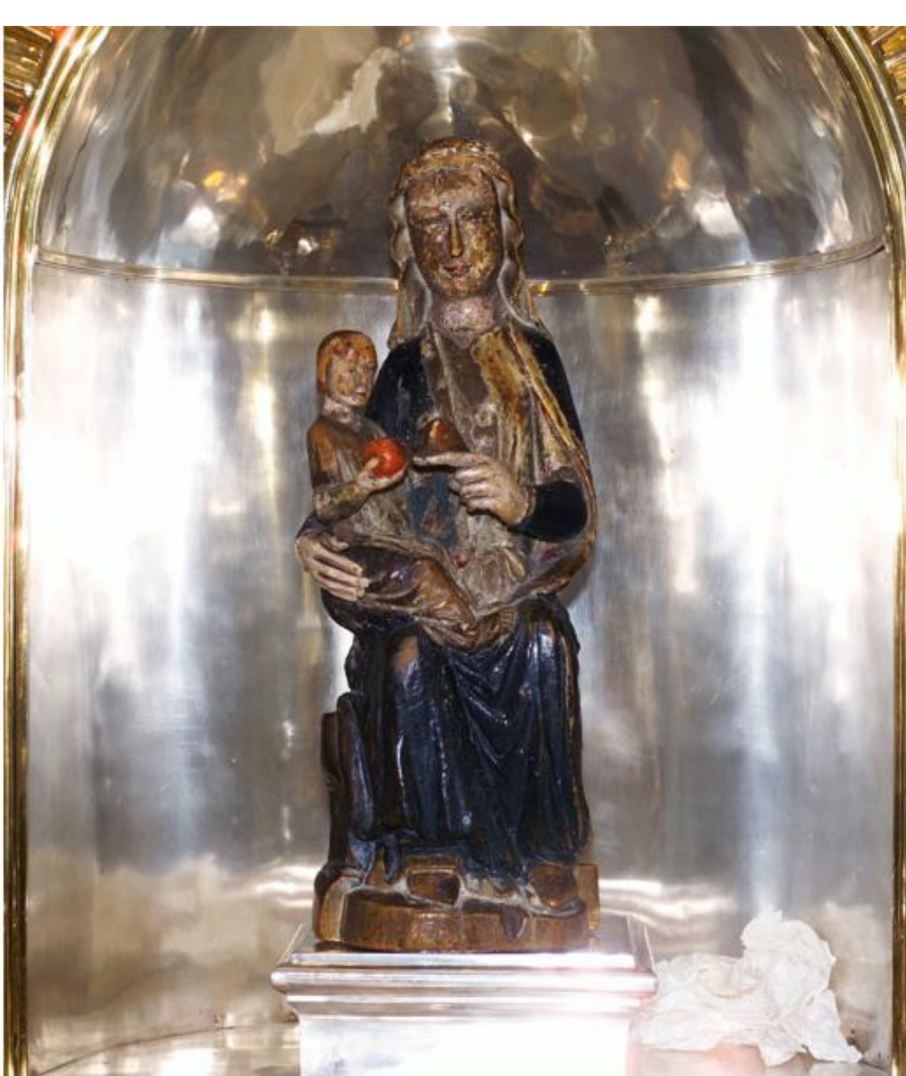
Madona z Mariazell (před 1300)