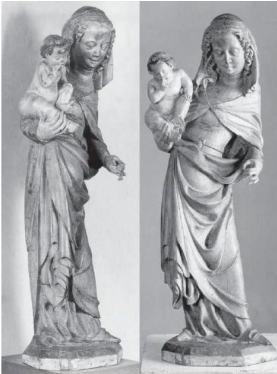
Madona ze Zahražan (70. léta 14. stol.)