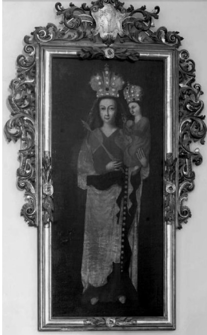
Panna Marie Žarošická