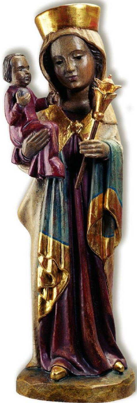
2/ Nápodoba Altöttinské madony z prostějovského soukromého majetku. Reprodukce snímku publikované J. Mathonem r. 1931