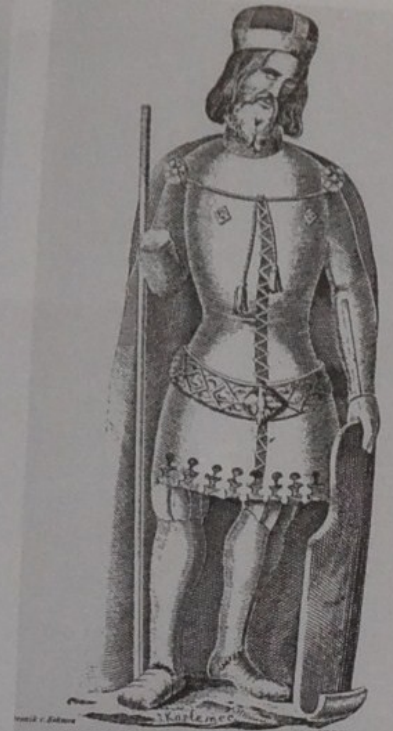
Standbild des heil. Wenzel von Peter Arler für den Prager Dom