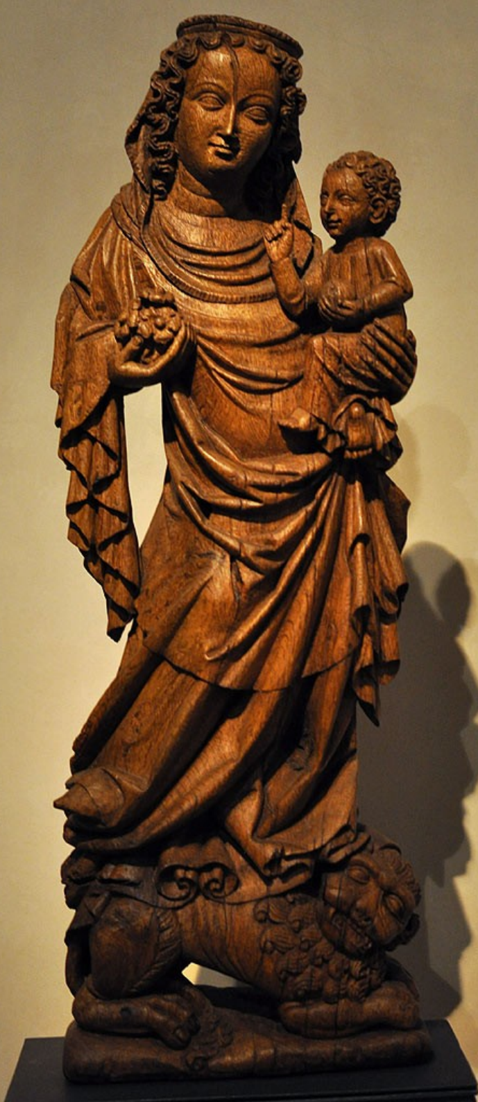
Tzv. Madona Klosterneuburská