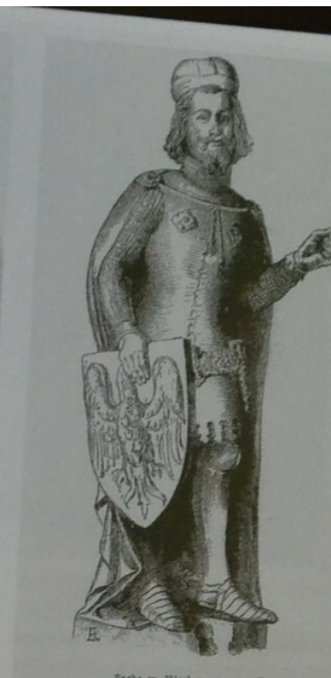
Socha sv. Václava