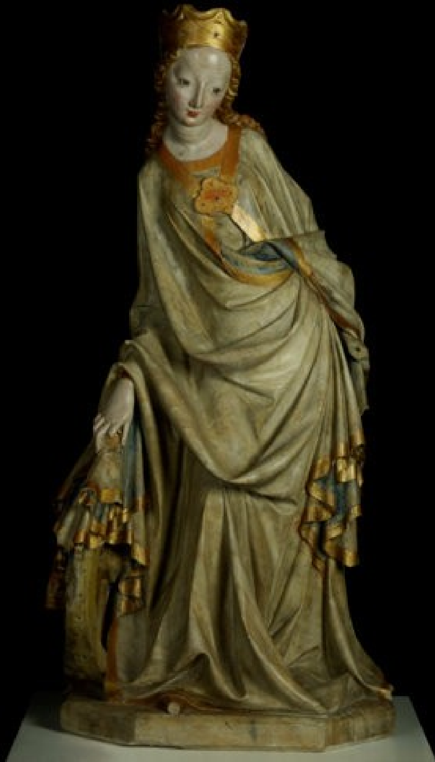
Sv. Kateřina z Jihlavy (1402?)