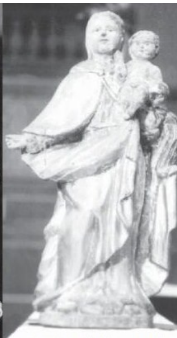
Obr. 12. Madona, Přísečnice, kostel Nanebevzetí Panny Marie. Národní památkový ústav – ústřední pracoviště Praha.