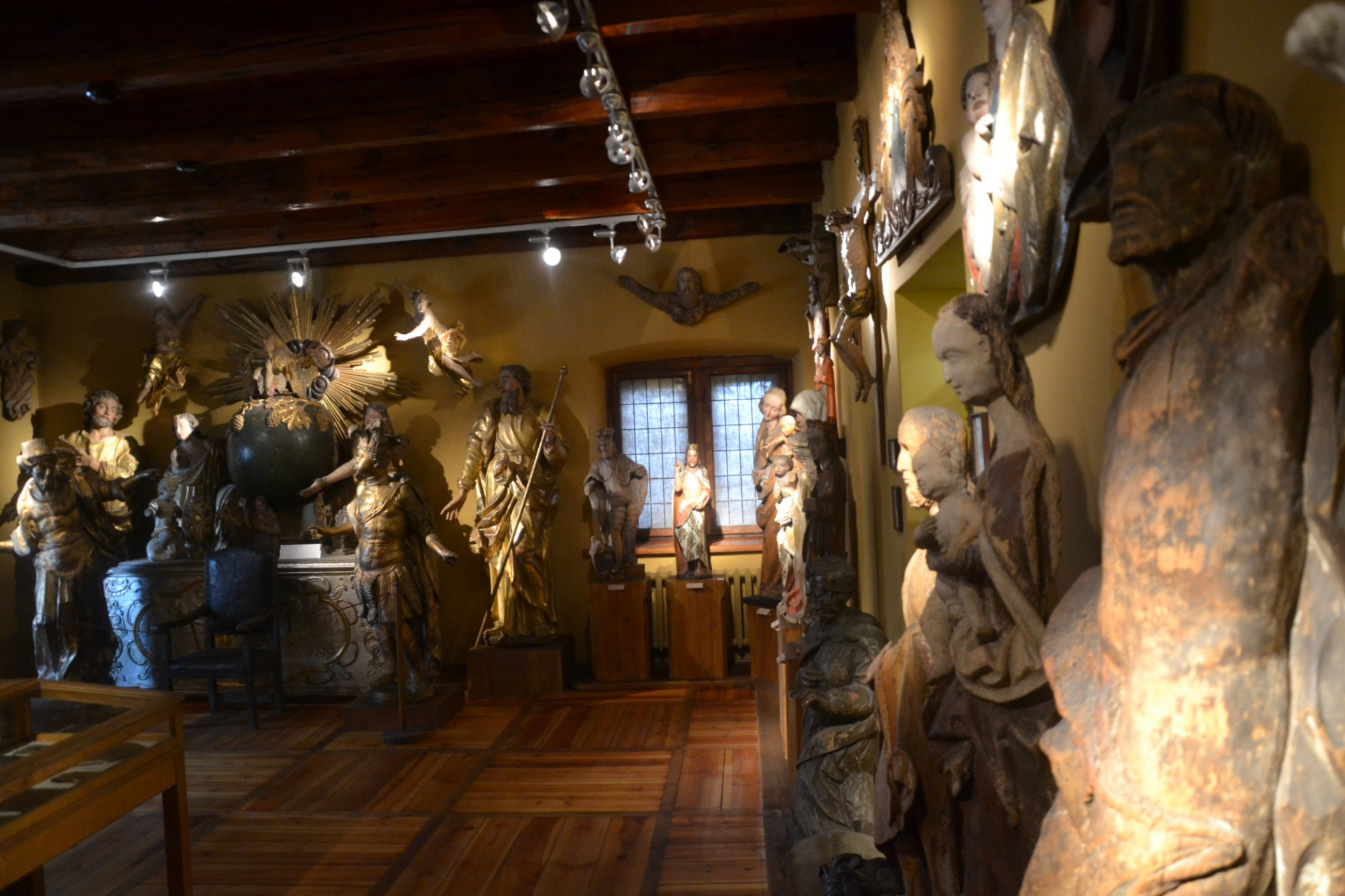
Dom Jana Długosza, Sandomierz