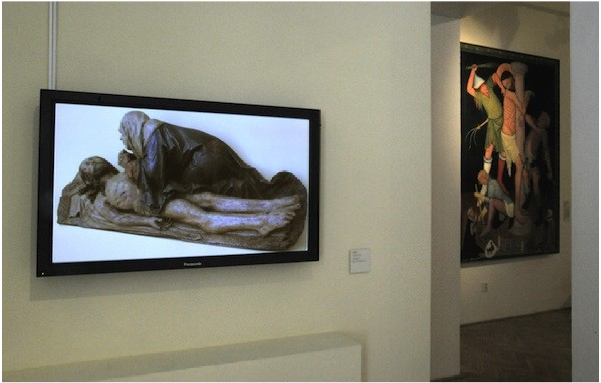
Filip Cenek, MG