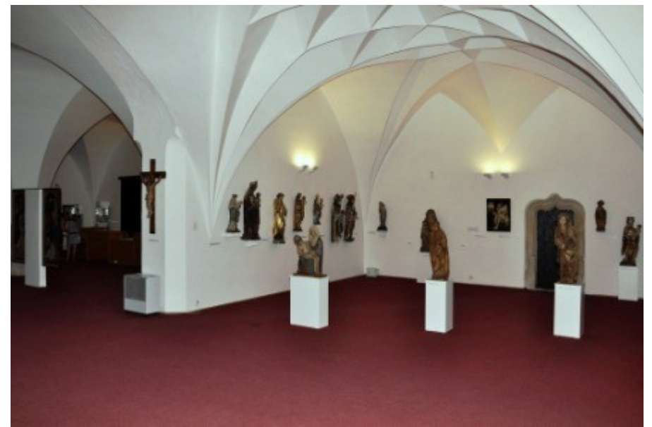
Oblastní muzeum v Chomutově