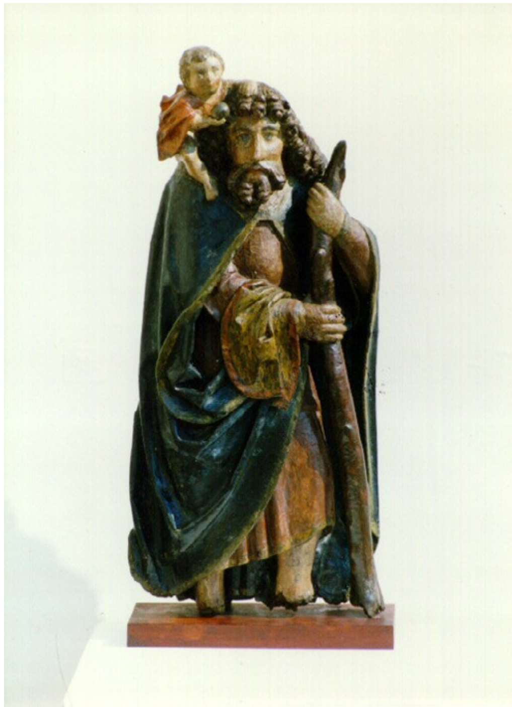
Muzeum Vyškovska ve Vyškově