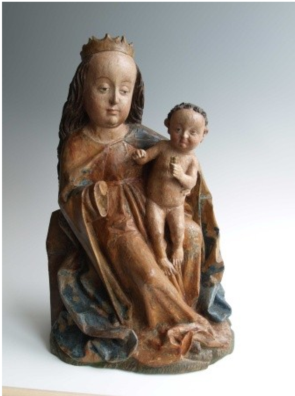
Zábřežské muzeum v Zábřehu