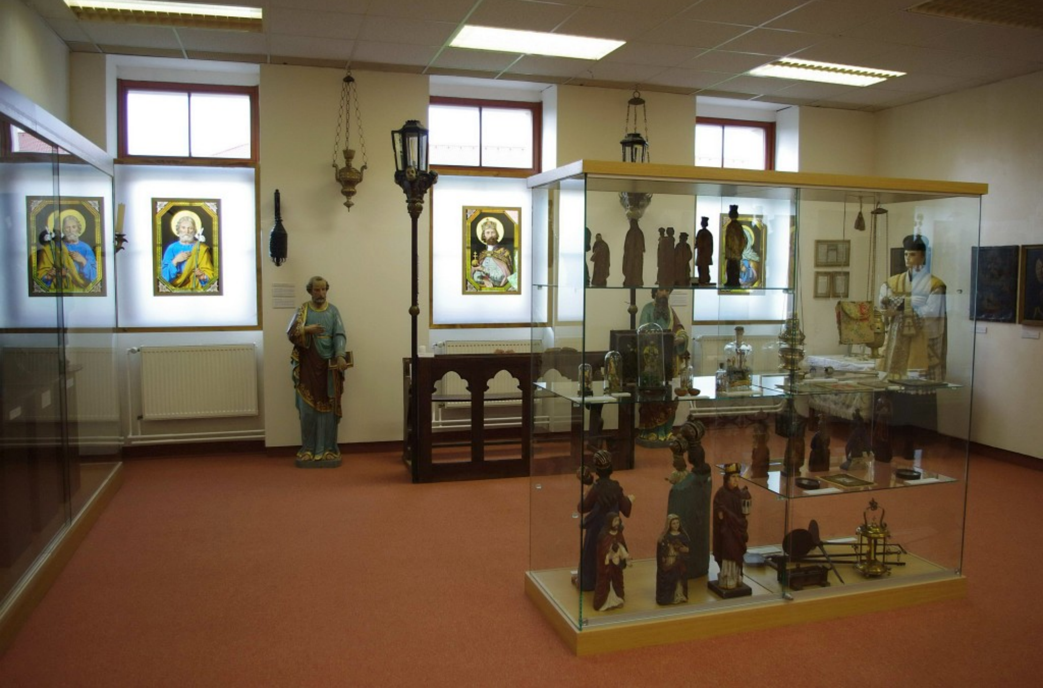
Muzeum Bojkovicka v Bojkovicích