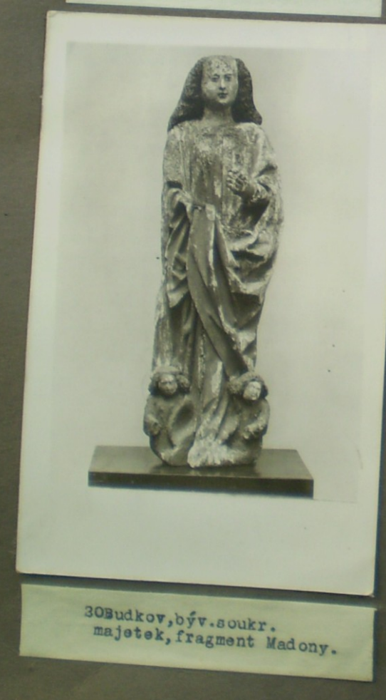
30 Budkov, býv. soukr. majetek, fragment Madony.