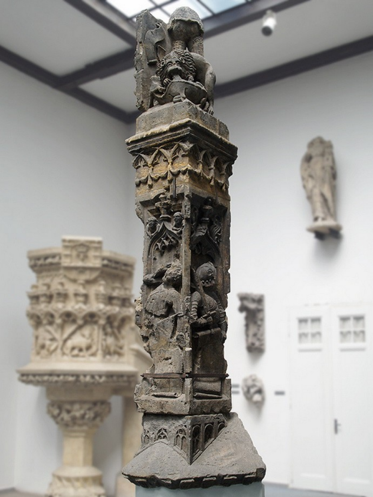
Lapidárium Národního muzea v Praze