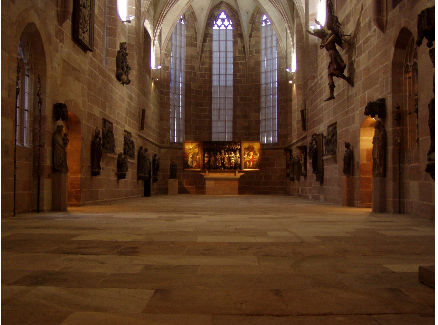
Germanisches Nationalmuseum Nürnberg