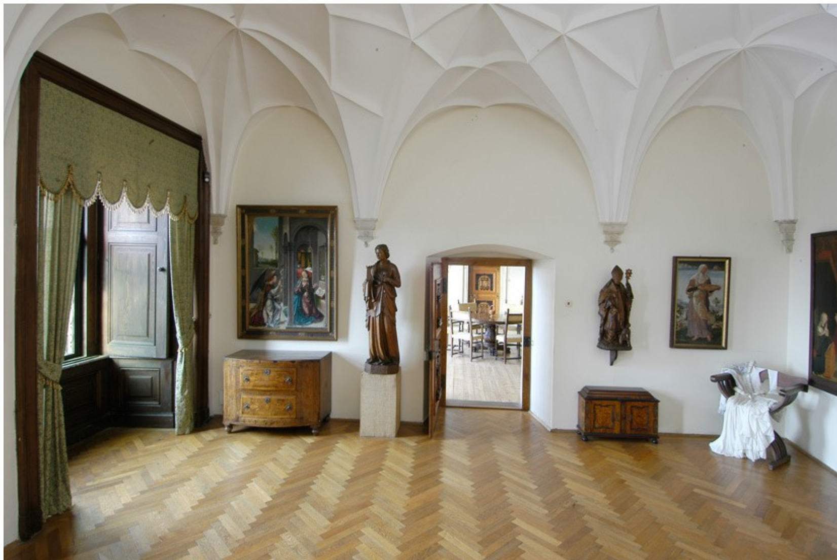
SH Šternberk na Moravě