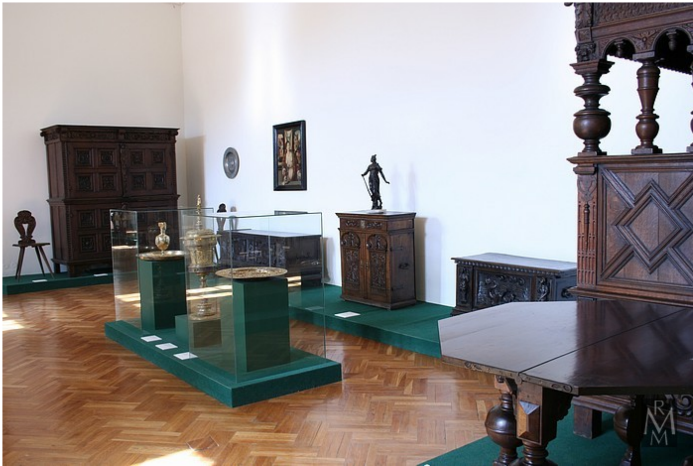
Regionální muzeum v Mikulově