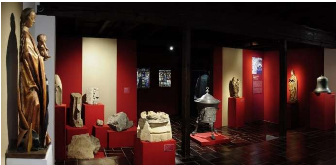
Regionální muzeum v Kolíně