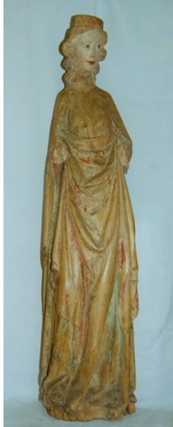
Městské muzeum v Polné