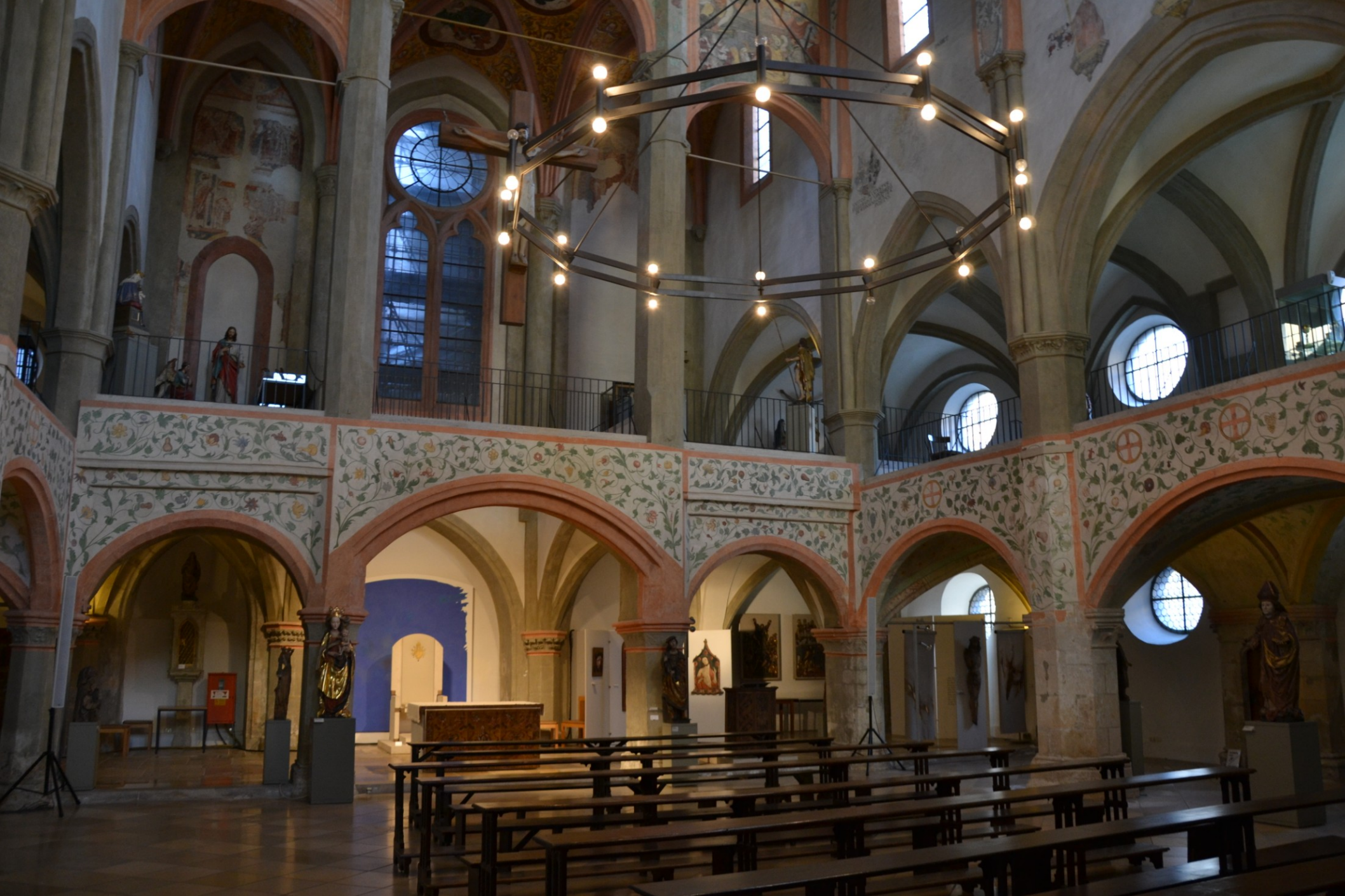
Žezno – kostel sv. Ulricha