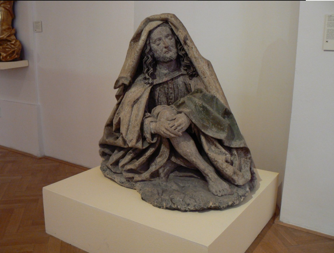
Olivetská hora z Modřic (Diecézní muzeum, MG, kostel)