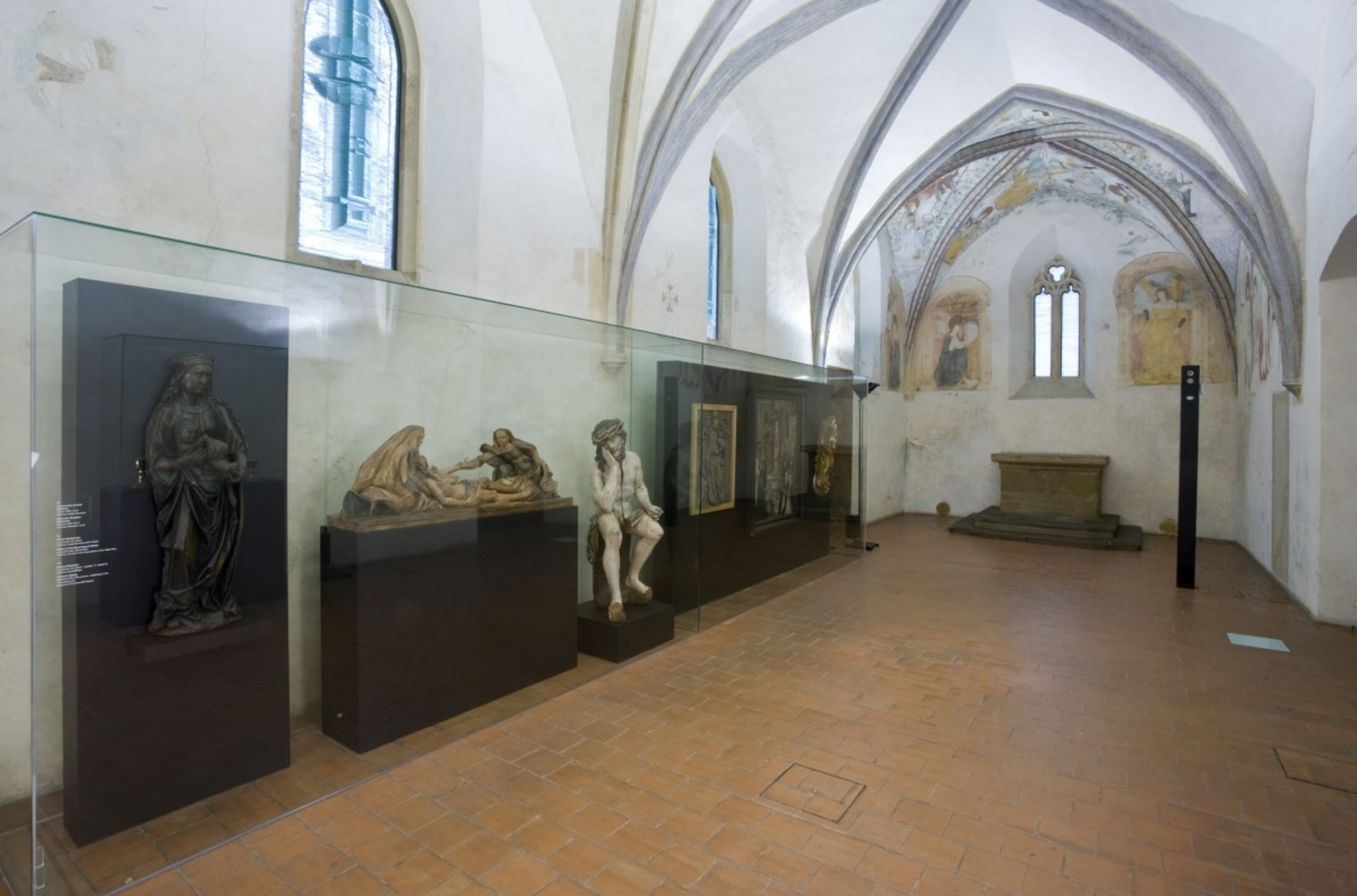
Arcidiecézní muzeum v Olomouci