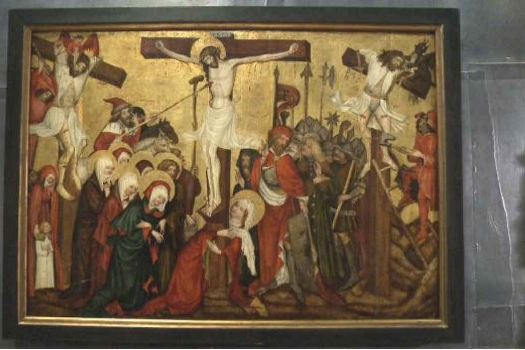
„Rajhradský“ oltář sv. Kříže z Olomouce (NG a MG)