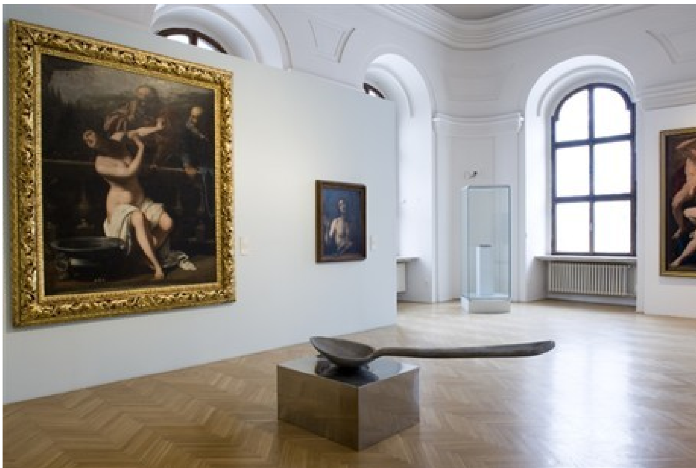
„Dostaveníčko“ v MG