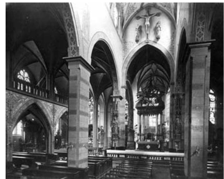
Kolumba v Kolíně nad Rýnem