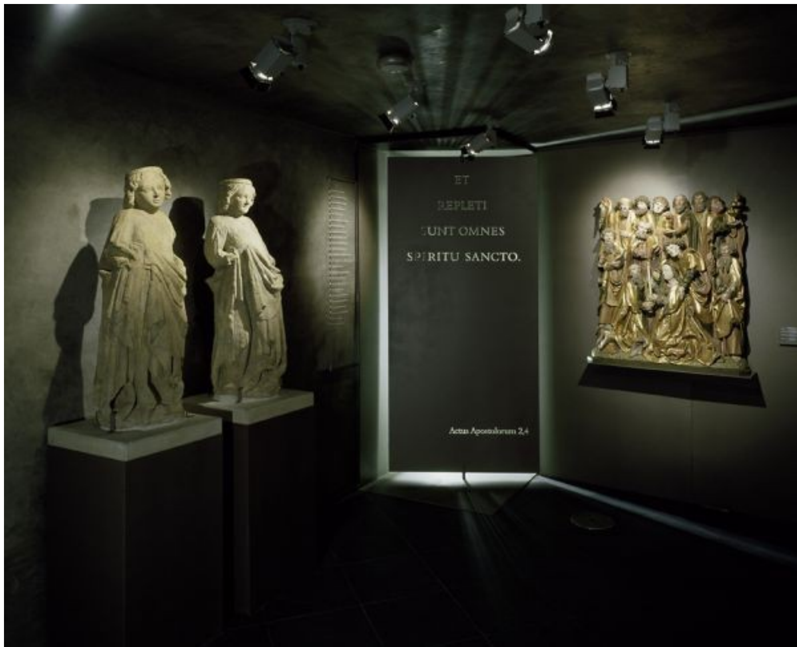
Diecézní muzeum Petrov (Brno)