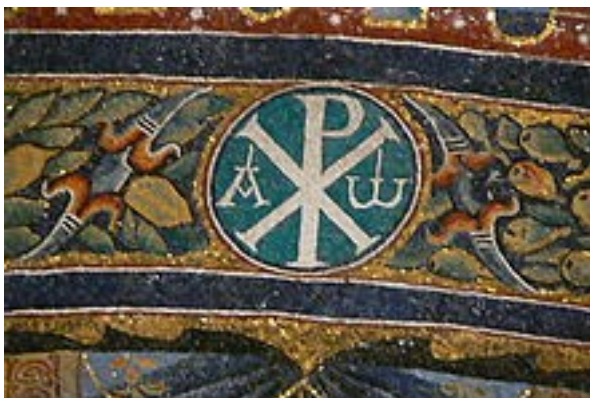
Alfa a omega na mozaice v římském kostele San Clemente (12. stol.)