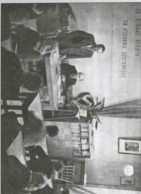
24 Kulturní domy často sloužily pro nejnáznivější propagandistické a osvětlové akce. Na obrázku vzorová ukázka lekce lidové zemědělské akademie v kulturním domě ve Vladislavi na Třebětsku. Foto: Göerner, Vladimír – Hromádka, Milan – Jaroš, Milošlav: Kulturní domy na vesnici . Praha 1962, s. 22.

mín „zařízení klubového typu“). Klubovní prostory se tudíž v nově projektovaných i adaptovaných kulturních domech stávaly významnými provozními částmi; nově se přitom řešila nutnost zajistit souběžný provoz klubové a sálové části, resp. provoz obou hlavních částí nezávisle na sobě. (Ještě výrazněji se tento trend projevoval v Polsku a Maďarsku, kde začala vznikat kulturní zařízení bez sálové části; tato koncepce přiblížovala klubová zařízení stylu kaváren.) V 60. letech již také silně zaostávalo technické zabezpečení kin působících v kulturních domech a vybavení dalšími přístroji a pomůckami využívanými pro vzdělávací kurzy mimoškolního vzdělávání. Celkově se poukazovalo na velmi nízkou úroveň vnitřního