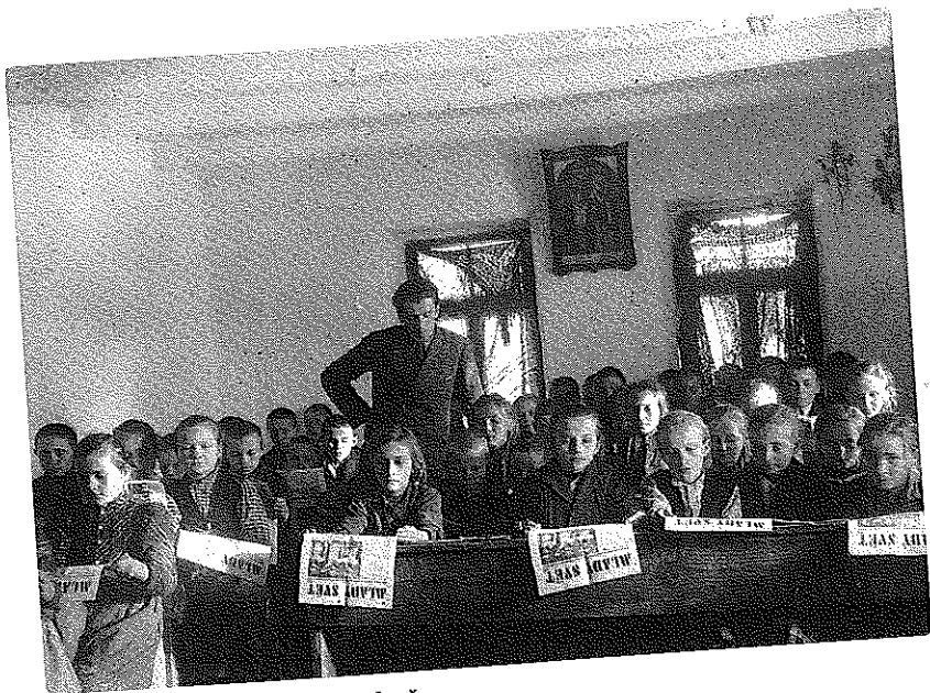
Školní děti v bulharském Vojvodově

Spolek pro podporu čs. zahraničních škol Komenský v Praze, který mj. hradil náklady na materiál pro stavbu nové školy ve Vojvodově.